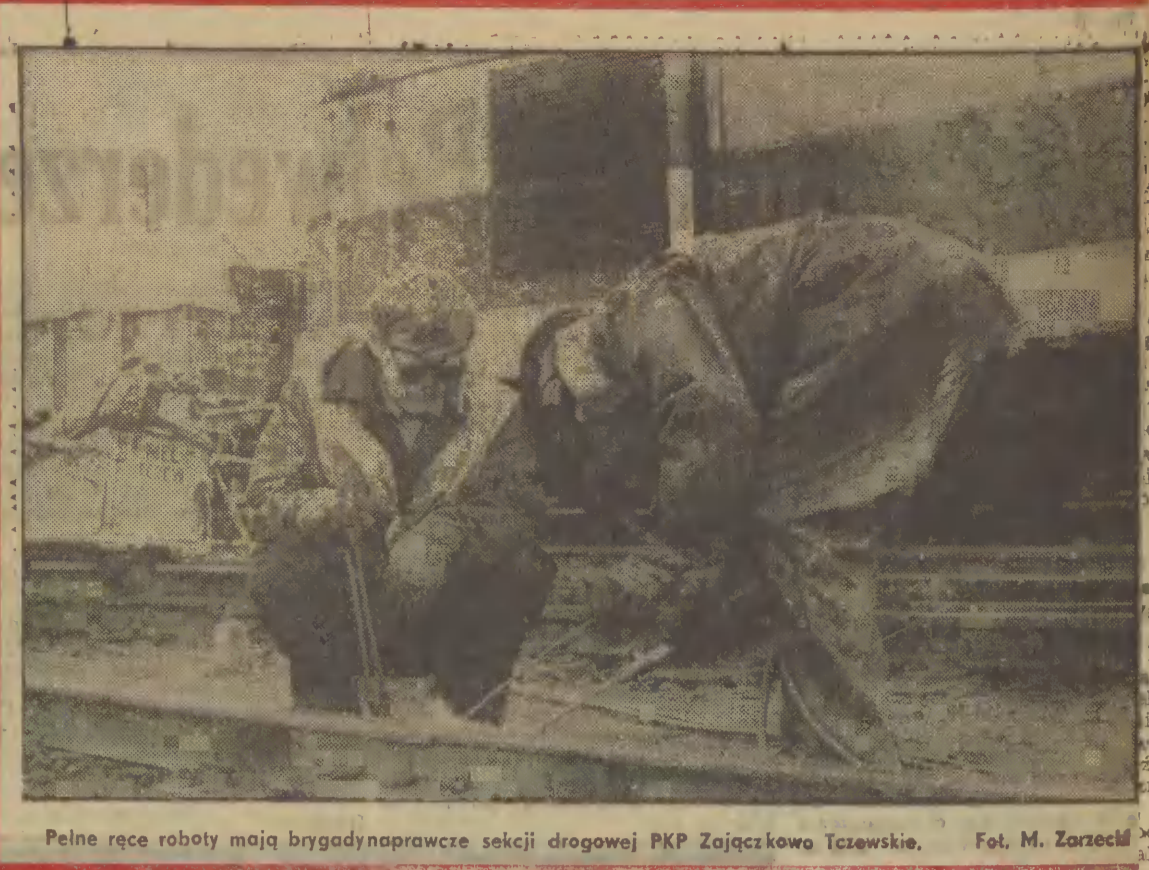
Pełne ręce roboty mają brigady naprawcze sekcji drogowej PKP Zajęczkowo Tczewskie.