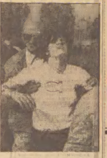
...było i tak.