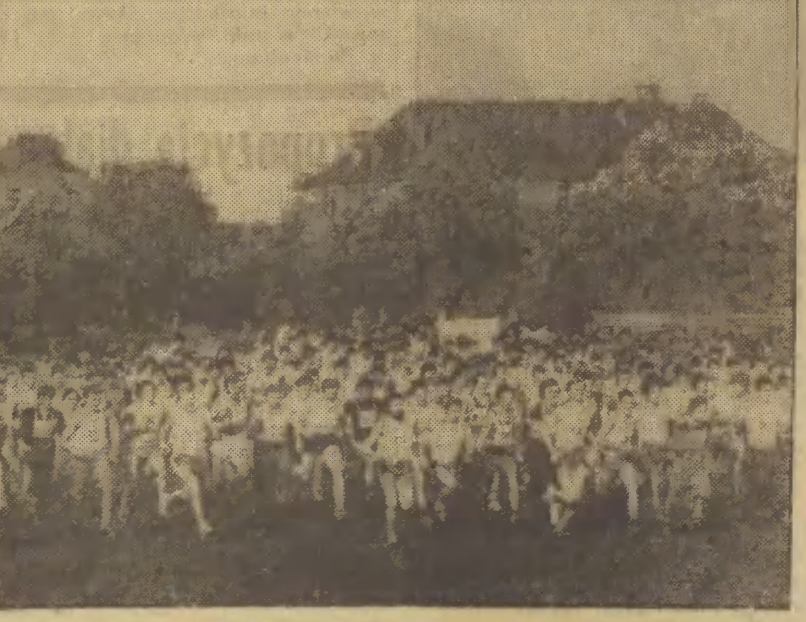
Na zdjęciu: start do biegu na 6000 m.