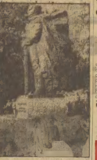
W 200-ną rocznicę śmierci Kazimierza Pałaskiego w Warszawie — rodzinnym mieście wielkiego Polaka — odsłonięto jego pomnik, dzieło artysty rzeźbiarza Kazimierza Danilewicza. Na zdjęciu: podczas uroczystości odsłonięcia pomnika.