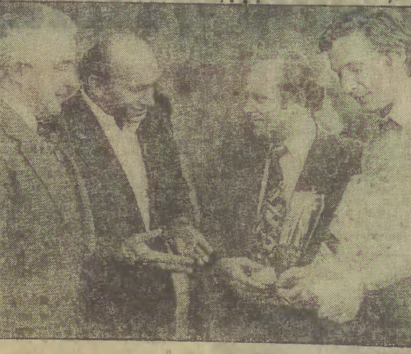
Moment wręczenia nagród.