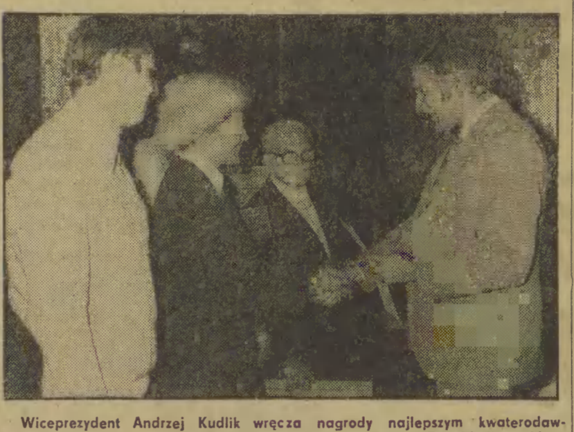
Wiceprezydent Andrzej Kudlik wręcza nagrody...