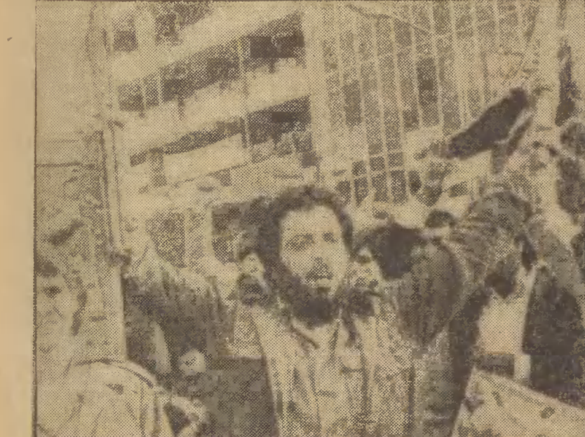
Uzbrojone postępowania studentów przed ambasadą.