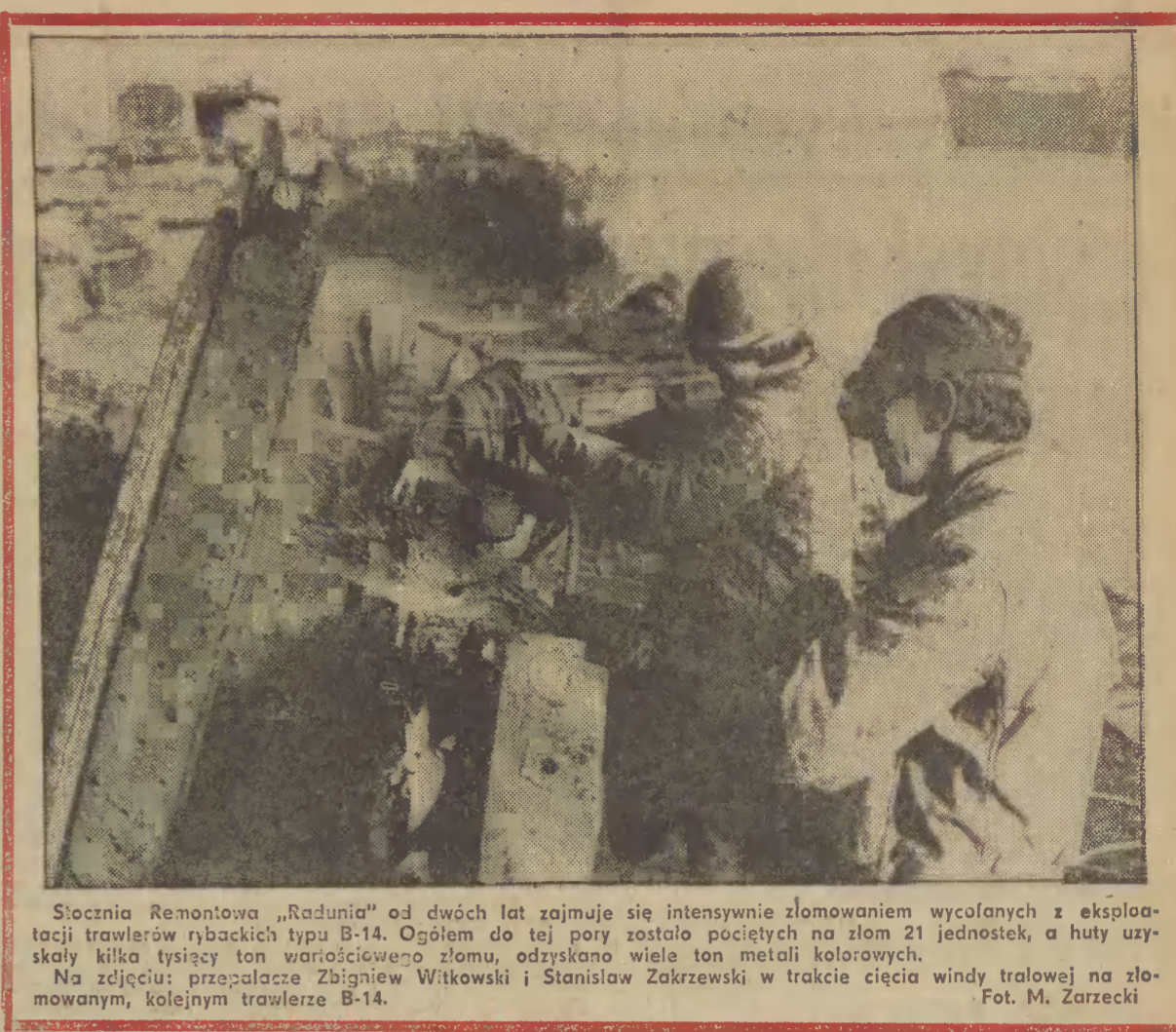
Stocznia Remontowa „Radunia” od dwóch lat zajmuje się intensywnie złomowaniem wycofaných z eksploatacji trawlerów rybackich typu B-14...