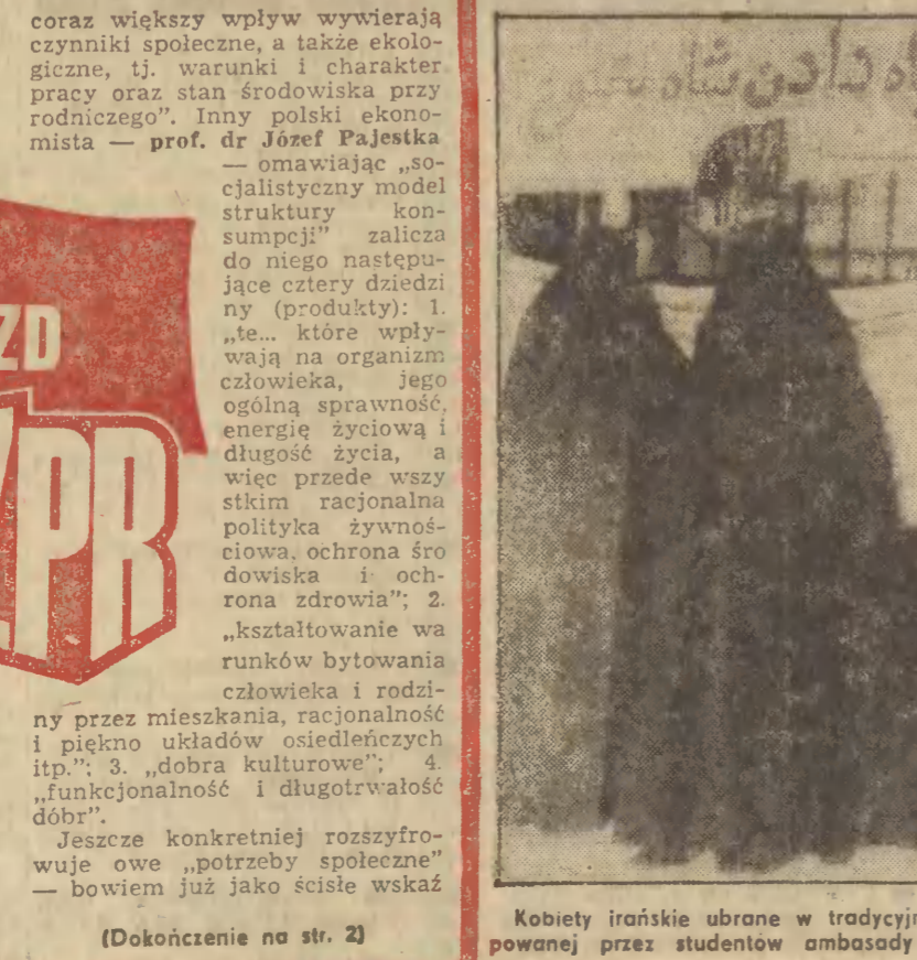
Kobiety irańskie ubrane w tradycyjne szaty zaglądnęły przez bramę okupowanej przez studentów ambasad amerykańskiej w Teheranie.