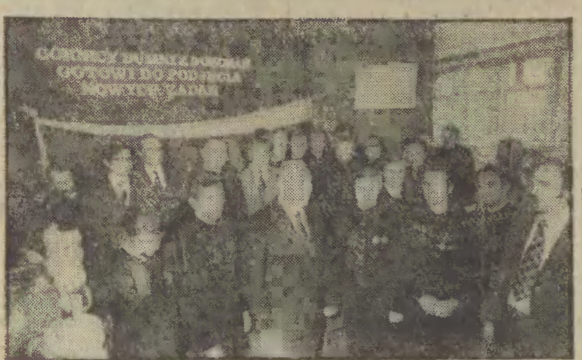
Spotkanie Edwarda Gierka z górnikiem kopalni „Sosnowiec”.