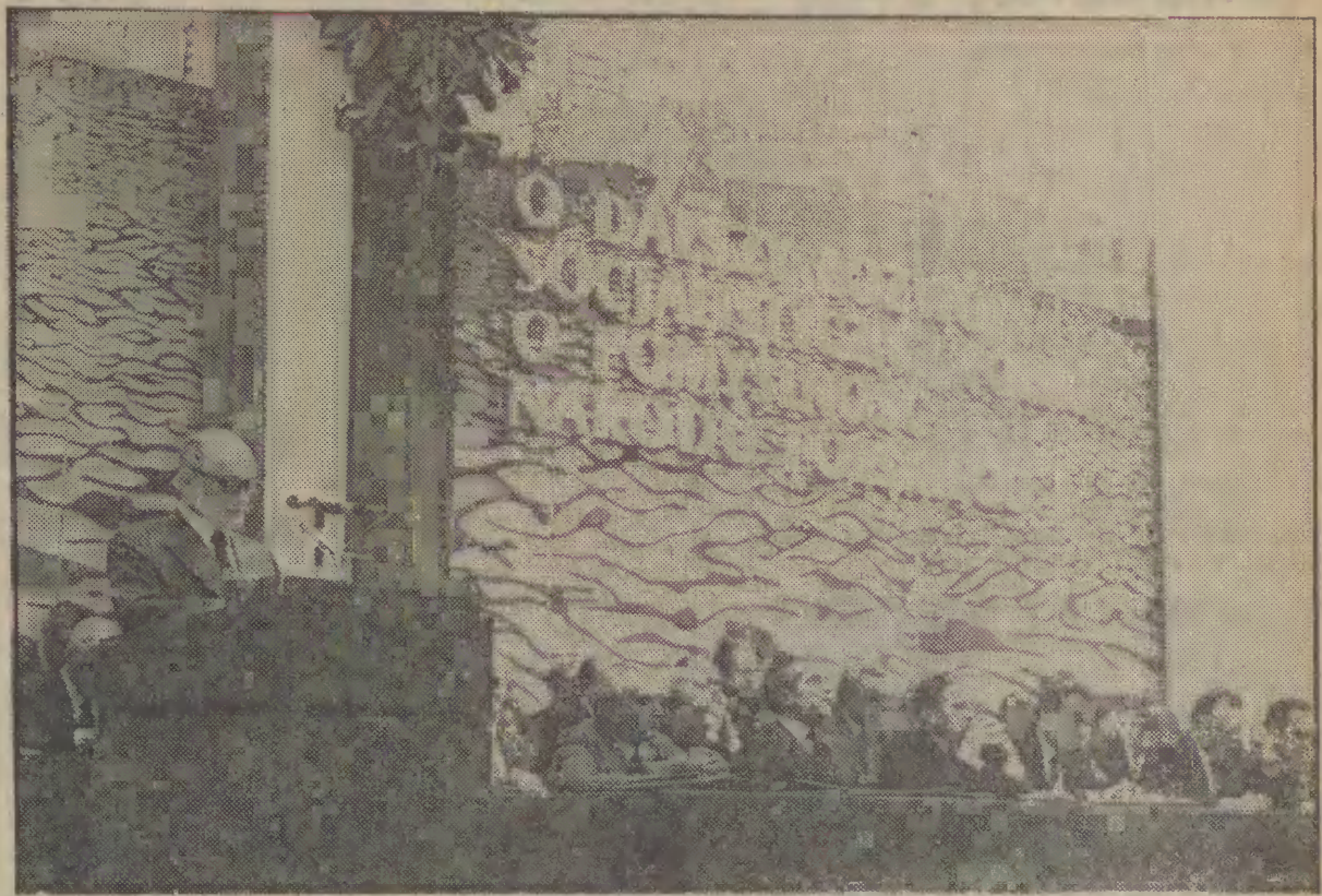
Na Konferencji Wojewódzkiej PZPR. I sekretarz KW Tadeusz Fiszbach wygłasza referat Egzekutywy KW.

Omówienie wystąpienia członka Biura Politycznego, sekretarza KC PZPR Stanisława Kanie na XVII Konferencji Wojewódzkiej PZPR zamieszczamy na str. 2.