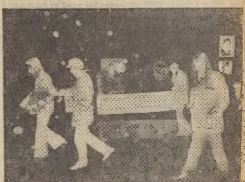
16 bm. przed okupowaną ambasadą USA w Teheranie odbyła się kolejna demonstracja studentów, którzy oświadczyli iż wobec zgody USA na wyjazd byłego szacha do Panamy proces zakładników amerykańskich jest nieunikniony.

Od wybuchu głębokiego kryzysu w stosunkach irańsko-amerykańskich, zapoczątkowanego zajęciem ambasady USA w Teheranie przez studentów irańskich i zatrzymaniem 50 obywateli Stanów Zjednoczonych, upłynęło już sześć tygodni. Obserwatorzy nie wykluczają, że istotny wpływ na dalszy kierunek rozwoju stosunków irańsko-amerykańskich może mieć wyjazd obalonego cesarza Iranu, Mohammada Rezy Pahlawiego do Panamy.