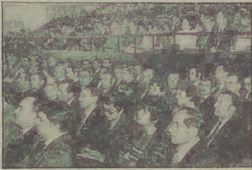
Sala obrad Konferencji Wojewódzkiej PZPR.