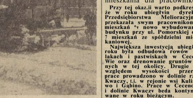
biegły oceniono dodatnio. Plan wartościowy i rzeczowy zało- ga tego przedsiębiorstwa wy- konała w stukilkunastu pro- centach wypracowując fun- dusz zakładowy w wysokości 789 tys. zł. Część tej kwoty uczestnicy konferencji posta- nowili przeznaczyć na nagro- dy — resztę na spółdzielcze mieszkania dla pracowników.

Ostatnio KSR obradowała w Rejonowym Przedsiębior- stwie Melioracyjnym. Rok u-