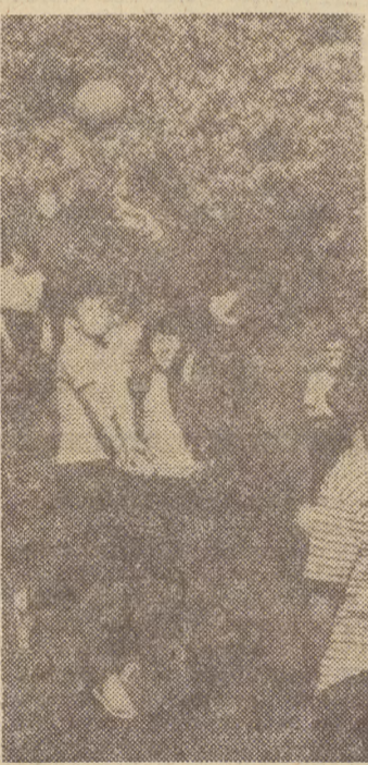
Śmiały kilka dni temu czechosłowacką młodzież i takie oto zdjęcia wykonał nasz fotoreporter podczas ich beztrószkich zabaw.