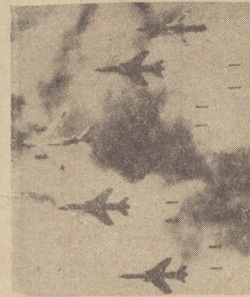
ZWIASTUNY PIRATÓW Samoloty amerykańskie kontynuują barbarzyńskie naloty na miasta i osiedla DRW. Na zdjęciu: samoloty F-105 i B-66 (pośrodku) w czasie nalotu.

W piątek 22 bm. Polskie Radio oraz Telewizja transmitować będą przebieg wojskowej defilady, manifestacji młodzieży oraz pa rady sportowców. Początek transmisji radiowej o godz. 9.55, a telewizyjnej o godzinie 9.45.