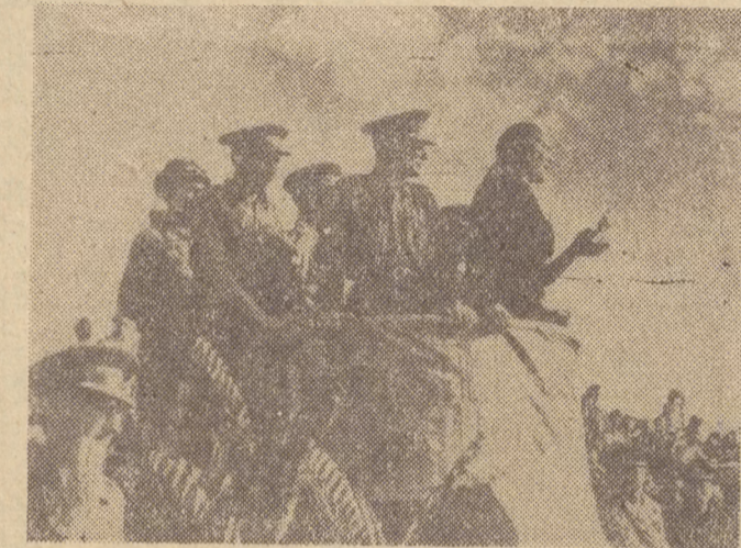
Dolores Ibarruri — obecnie przewodnicząca Hiszpańskiej Komunistycznej — przemawia do żołnierzy Brygad Międzynarodowych (zdjęcie z 1937 roku). Obok stoi generał Walter Karol Świerczewski.

wych, w których kształtowaniu, jak i w walkach, tak doniosłą rolę odegrały Brygady Międzynarodowe — zbrojne oddziały „międzynarodowego Frontu Ludowego”, jak o nich piszą dziś uczestnicy ówczes-