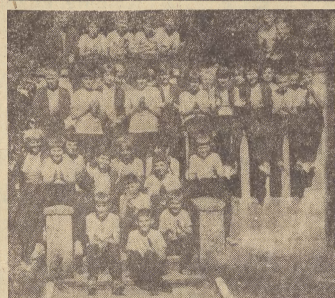
Jak już informowaliśmy, w Ustce wypoczywa w lipcu 40-osobowa grupa młodzieży szkolnej z Libercza. Odwiedzili

W Ustce w dn. 22 i 24 bm. sklepy będą również otwarte jak w każdą niedzielę. Dyżurni będą 2 sklepy spożywcze PSS i MHD przy ul. Marynarki Wojennej. Natomiast sobota jest dla handlu normalnym dniem pracy. Czynne więc będą wszystkie placówki i punkty sprzedaży. Wszystkie inne zarządzenia poszczególnych dyrekcji przedsiębiorstw handlowych o zamykaniu w tym dniu podległych placówek są sprzeczne z pismem ókólnym MHW, jakie wydano w tej sprawie.