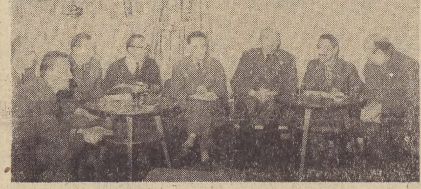
Na zdjęciu: gen. bryg. pil Roman Paszkowski wraz z towarzyszącymi mu oficerami Wojsk Obrony Powietrznej Kraju w czasie spotkania z przedstawicielami dziennikarskiego środowiska koszalińskiego.

Rok XV Piątek, 14 X 196S r. Nr 246 (4331)