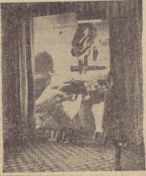
W salach Biura Wystaw Artystycznych w Poznaniu otwarto wystawę „Satyra antywojenna”. — Składa się na nią 77 fotomontaży M. Bernana, dotyczących minionej wojny i obecnej sytuacji międzynarodowej z Wietnammem włącznie.

Ka zdjęciu: fotomontaż, zatytułowany „Cel — pal”.