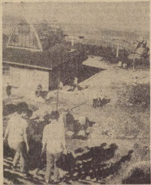
SEZON TURYSTYCZNY W PEŁNI

W miejscowościach wczasowych Dolnego Śląska — w Karpaczu, Bierutowicach, Polanicy, Szklarskiej Porębie — jak w czasie letnich upałów. — Wiele wycieczek, wczasowiczów i turystów. Wysokie temperatury, piękna, słoneczna pogoda zachęca wiele osób do spędzenia w tych rejonach wolnego czasu. Na zdjęciu: turyści ze Szreniecy w pobliżu schroniska, <EAF>