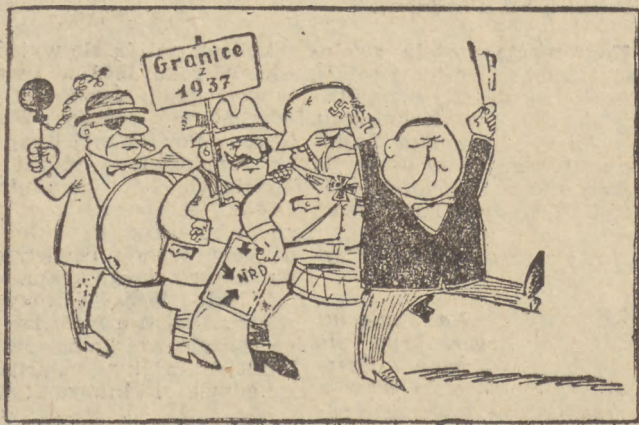
A wasze niedoczekanie, panowie odwetowcy z Bonn!!! RyS. Schrade