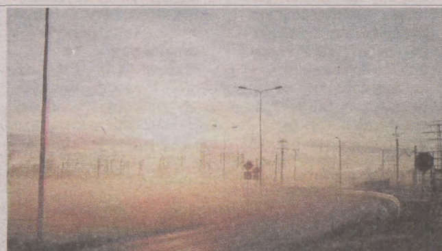
4. Jadwiga Makowska-Lemke, Słupsk, TFG.S31