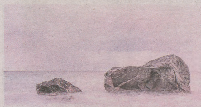
2. Paweł Młynarski, Słupsk, TFG.254