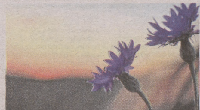
4. Sandra Kwiecień, Motarzyno, TFG.259