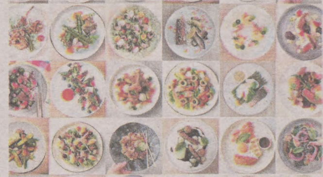
1. Dariusz Wierzchowski, Ustka, TFG.25