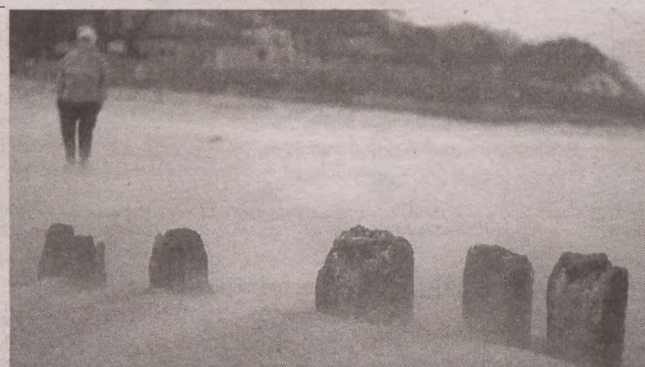
3. Andrzej Firkowski, Słupsk, TFG.433