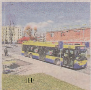
Autobusów jeździ mniej, ale kontrole ciągle się odbywają

Wśród pogodzinie 15 nasza czytelniczka jechała autobusem Erir nr 2k. Podczas tego kursu przeprowadzano kontrolę biletów. Kobieta twierdzi że kontrolerka przeszła przez cały autobus, sprawdząc ludzi o biletach, ale nie była odpowiednio przygotowana do tak bezpośredniego kontaktu z pasażerami.