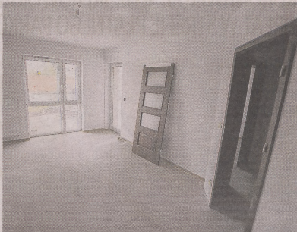
Inwestycją zajmuje się miejska spółka Słupskie Towarzystwo Budownictwa Społecznego

Przy budynku od strony Lidia planowano dwupoziomowy parking na 48 aut. Nie powstał jednak, koszt ze względu na wody, byłby za duży. Będzie jednopoziomowy na 24 miejsca. Miejsca te będą do wykupienia. A parking będzie ogrodzony, wjazd przez bramę z pilotem. Przypomnijmy, inwestorem jest STBS, a wsparcie finansowe uzyskał słupski samorząd. Dwa budynki wielorodzinne wraz z niezbędną infrastrukturą towarzyszącą, drogami wewnętrznymi i małą architekturą buduje słupska firma SIMA. Koszt to niecałe 13,2 mln zł. Sam koszt budowy budynku Długa 30 (zasiedlanego przez miasto) to 8,3 mln zł, ale udział finansowy miasta wynosi w tym 6,6 mln. Połowa tej sumy ma zwrócić się dzięki dotacji z Banku Gospodarstwa Krajowego. Wówczas koszt metra wg wycenienia ratusza dla 33 lokali spada do 2,4 tys. zł.