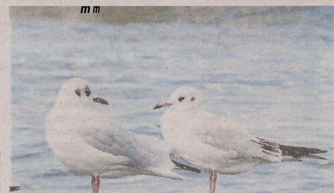
5. Ewa Adamczyk, Świącino, TFG.202