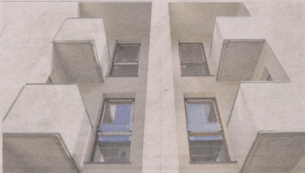
Dotąd tak miasto nie budowało. Tak, to znaczy na bogato

- W pełni podpiwniczony. Przystosowany dla osób niepełnosprawnych. W każdej klatce są windy, chociaż kondygnacje