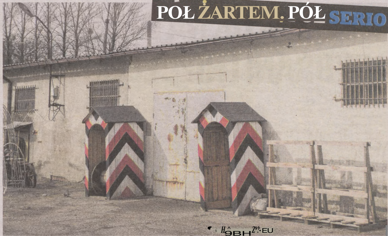
Miasto postawione nabaczność... Na zdjęciuteren .strzeżony" przy ulicy Witkacego w Słupsku