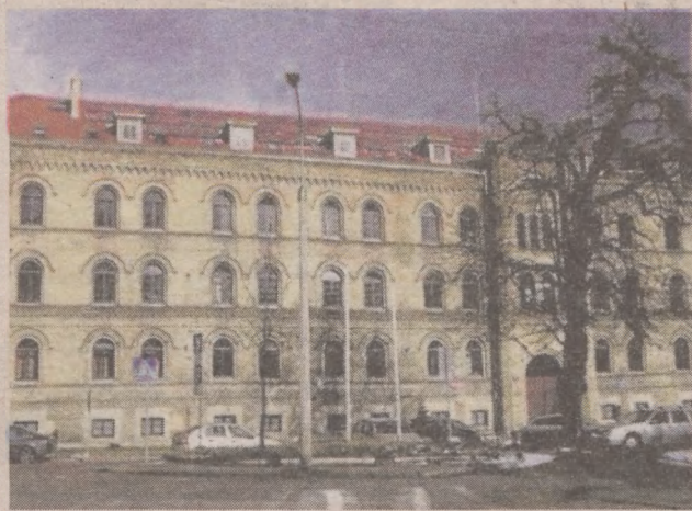
W poniedziałek budynek urzędu marszałkowskiego był zamknięty, bo trwałego odkażenie