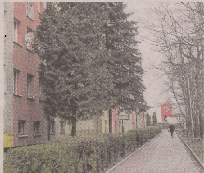
Drzewa niemal całkowicie zasłaniają mieszkańcom okna

Mieszkańcy bloku przy ul. Banacha 7 mają problem z drzewami, które zasłaniają im okna od mieszkań. O ich przycięcie apelowali do Zarządu Infrastruktury Miejskiej, ale inspektorzy ZIM-u uznali prośbę za bezzasadną.