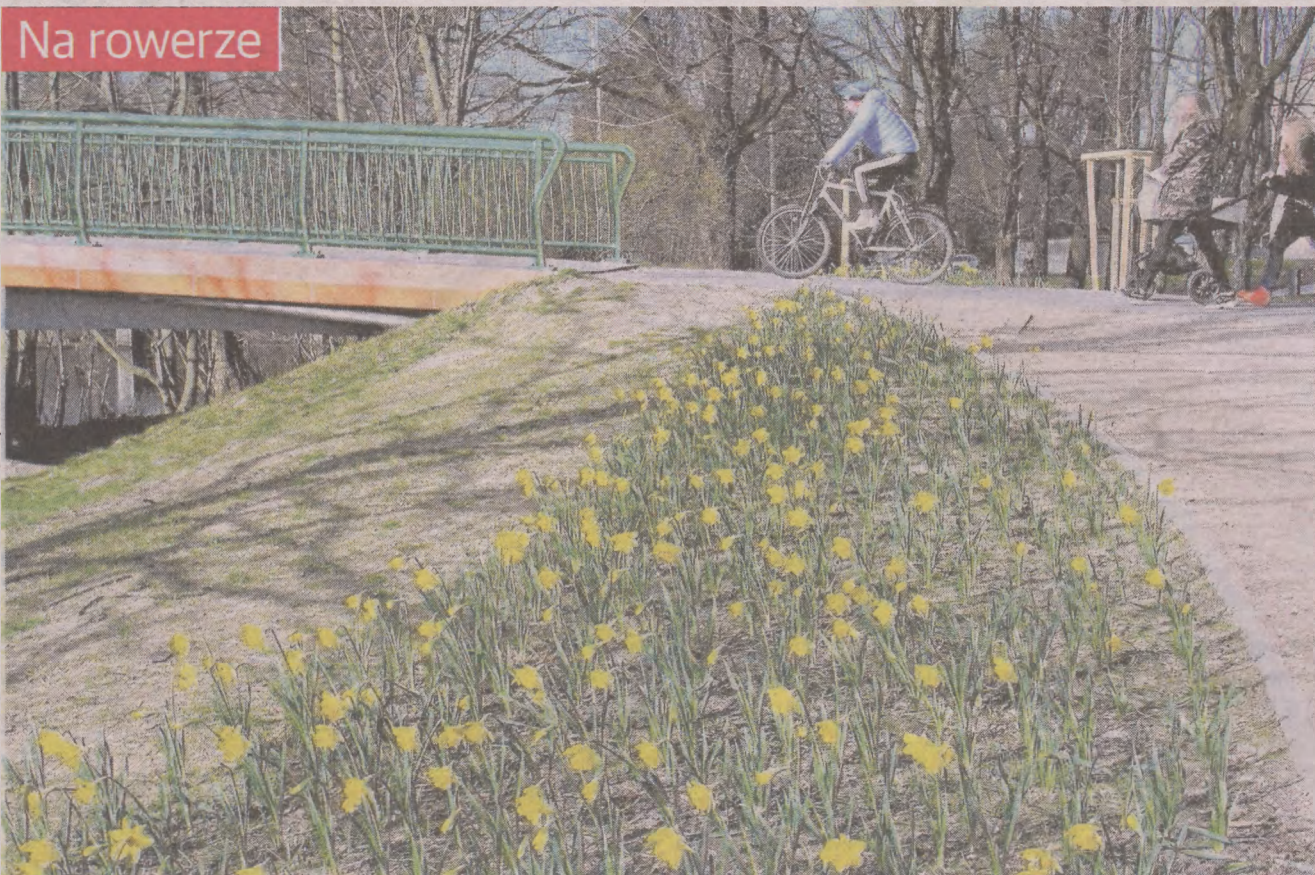
Kobierzec kwitnących żonkili przy trasach pieszo-rowerowych w Parku Kultury i Wypoczynku nad Słupią