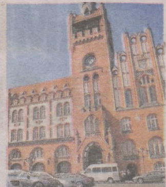
W czasie epidemii wizyty w ratuszu są bardzo ograniczone

Przypomnijmy, 17 marca w UM podjęto decyzję, że używanych samochodów nie trzeba rejestrować. Wydano komunikat: „Urząd Miejski w Słupsku pragnie uspokoić mieszkanki i mieszkańców naszego miasta, którzy obawiają się, że może spotkać ich kara finansowa w związku z ograniczeniami w funkcjonowaniu instytucji, urzędów w kontekście obowiązku rejestracji pojazdów. Jeśli chodzi o zagrożenie karą za niedokonanie w 30-dniowym terminie rejestracji pojazdu sprzedanego z innego kraju UE albo niezłożenia w takim samym terminie nabycia/zbycia pojazdu zarejestrowanego w kraju informujemy, że obecna sytuacja epidemiologiczna jest traktowana jako siła wyższa w rozumieniu KPA. W związku z tym, w tym wyjątkowym czasie, jaki nałożyło na nas wszystkich Rozporządzenie Ministra Zdrowia, wprowadzające stan zagrożenia epidemicznego na terenie całej RP, nie będą nakładane kary z tytułu naruszenia obowiązku rejestracji”. ©©