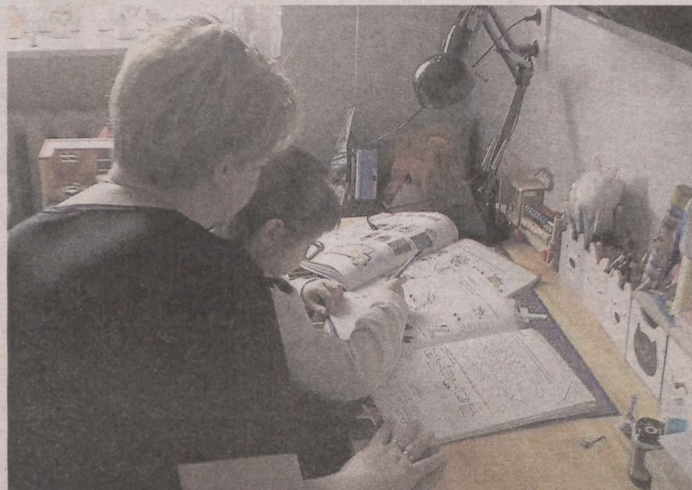
Pani Ania biega między kuchnią, a pokojami. Jest geografem, polonistką, plastyczką i rehabilitantką