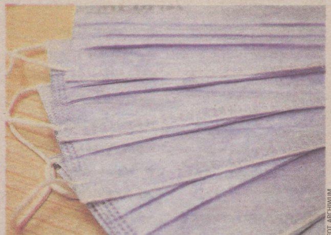
Maseczki trafiają do mieszkańców stopniowo - każda nowa partia, którą dostaje ratusz jest na bieżąco przekazywana