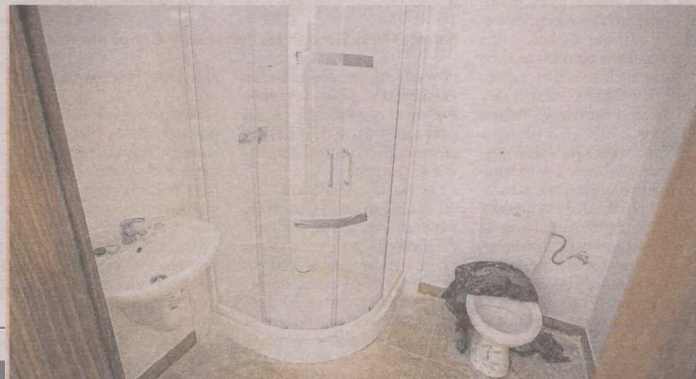
Wyposażenie łazienek i kuchni już jest