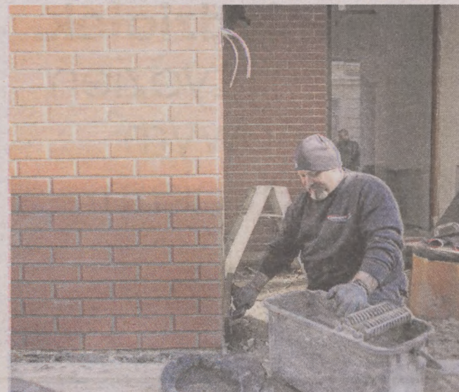
Na budowie praca wre