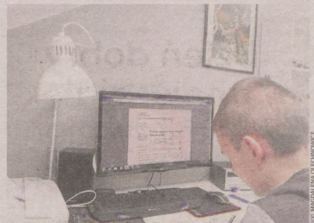
W poniedziałek, wtorek i środę uczniowie ósmych klas zdalnie mogli przystąpić do egzaminu próbnego

W środę - język obcy. W poniedziałek, 30 marca, ósmoklasiści pisali próbny egzamin z języka polskiego, we wtorek z matematyki, w środę z języka obcego. W większości szkół uczniowie do egzaminu przystępowali dobrowolnie. Niektóre szkoły zalecały uczniom napisanie egzaminu, ale nie było to obowiązkowe. Nie wymagano też od nich, aby przysyłali rozwiązania. Niektórzy uczniowie nawet nie wiedzieli, że taki egzamin się odbywa. Szkoły w Słupsku różnie podeszły do tego tematu. Przystąpienie do egzaminu w takich warunkach to zbyt