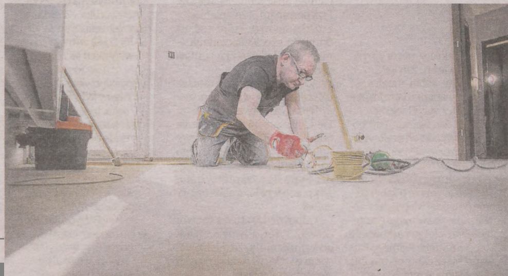
Dwóch tygodni potrzeba, by budowlący dokończyli ostatnie prace