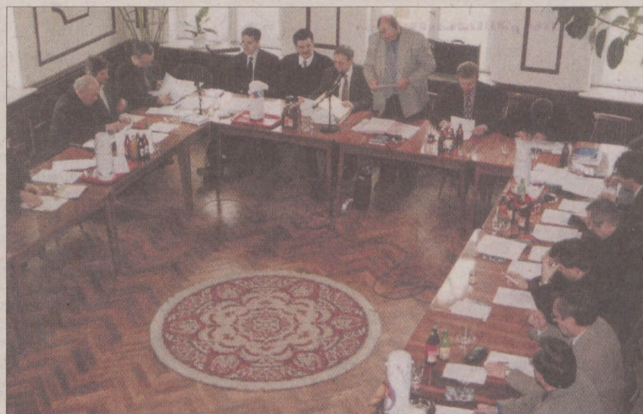
Radni wytrwale pracowali przez ostatnie 4 lata. Teraz nadszedł czas ich oceny.