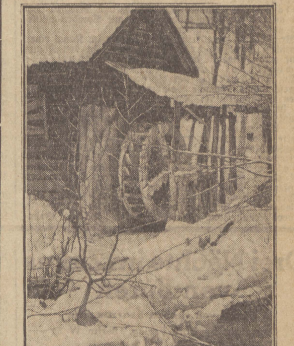
Der Winter hat hier ein schönes Bild hervorgezaubert. Der Mühlbach präsentierte zwar noch munter weiter, doch ist das Mühlrad bereits mit schwerem Eis behängt.

Im Mittelpunkt der Gaufraktionsammlung, die der Gau Pommern am Sonnabend und Sonntag durchführte, stand ein Volksliedwettbewerb. In allen pommerschen Haushaltungen waren sogenannte „Stimmzettel“ verteilt worden, auf denen zehn der schönsten Volkslieder verzeichnet waren. Zu diesem Volksliedwettbewerb sind insgesamt 498 160 Stimmen abgegeben worden. Davon entfielen die meisten, und zwar 149 238, auf das Soldatenlied „Steh' ich in finst'rer Mitternacht“. An zweiter Stelle stand mit 78 851 Stimmen das Volkslied „Am Brunnen vor dem Tore“, an dritter Stelle rangierte mit 73 601 Stimmen die Volksweise „Wenn ich den Wandrer frage...“ Dieses Abstimmungsergebnis wurde am Sonnabendabend auf einer Großversammlung für das Kriegswinterhilfswerk in den Stettiner Zentralhallen bekanntgegeben. Die Vereinigten Stettiner Handwerkerchor sangen im Rahmen eines bunten Unterhaltungsprogramms diese drei Volkslieder, die sich die Pommern als ihre liebsten Lieder ausgesucht hatten.