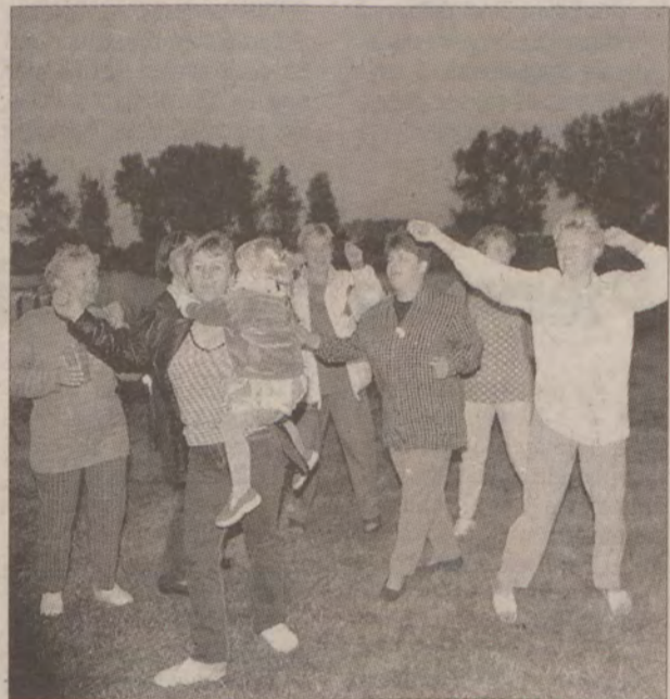
Podczas otwarcia nie zabrakło także tańców. Bawiono się przy muzyce, którą grał zespół z Peru.