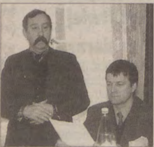
Podczas sesji radni z Nowego Stawu próbowali ponownie odwołać zarząd.