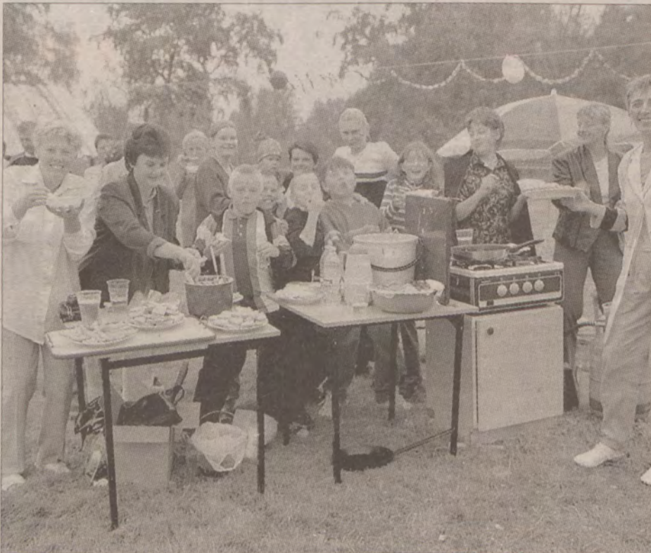
Mieszkanke Pogorzalej Wsi na otwarcie centrum rekreacyjnego przygotowały wiele posiłków. Na miejscu smażono, m.in. placki ziemniaczane.