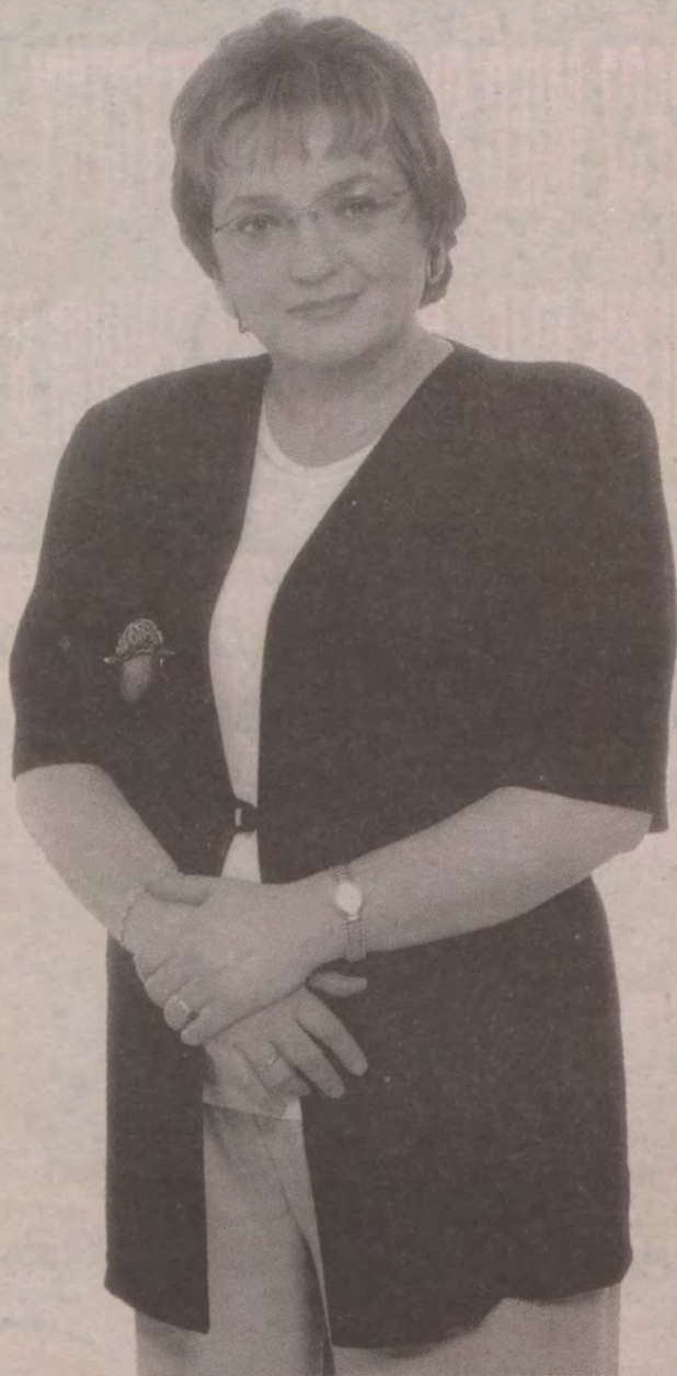
Małgorzata Ostrowska, poseł na Sejm RP