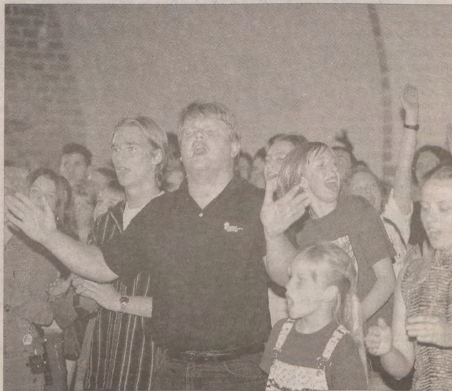
Podczas koncertu publiczność klaskała i śpiewała wspólnie z zespołem.