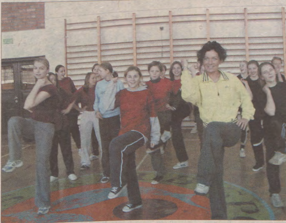
Odrobina gimnastyki jeszcze nikomu nie zaszkodziła.