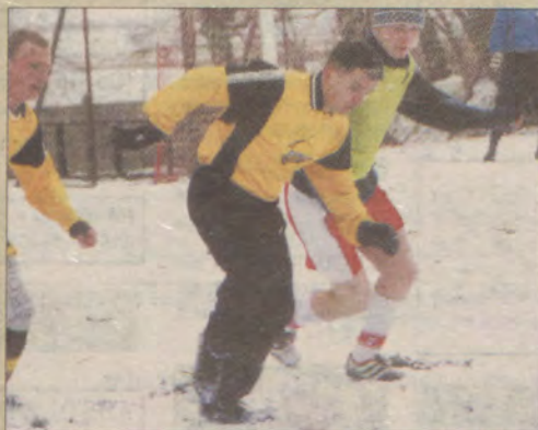
Bytovia Drutex w sparingach rzadko występuje w pełnym składzie.