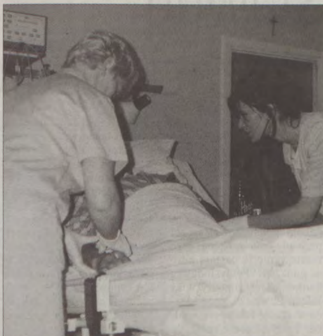
W niedzielę, 9 marca, bytowski szpital będzie otwarty dla wszystkich pacjentów.