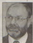
Fot. L. Literski