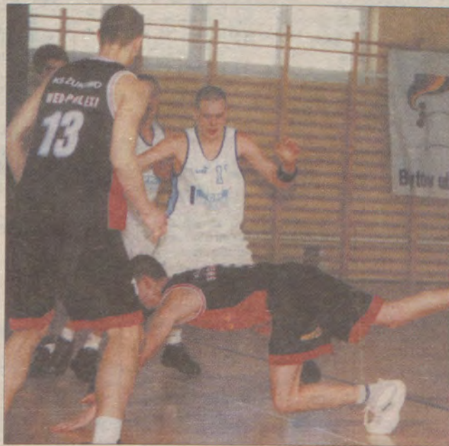
Bytowscy koszykarze w obecnym sezonie grają bardzo słabo.