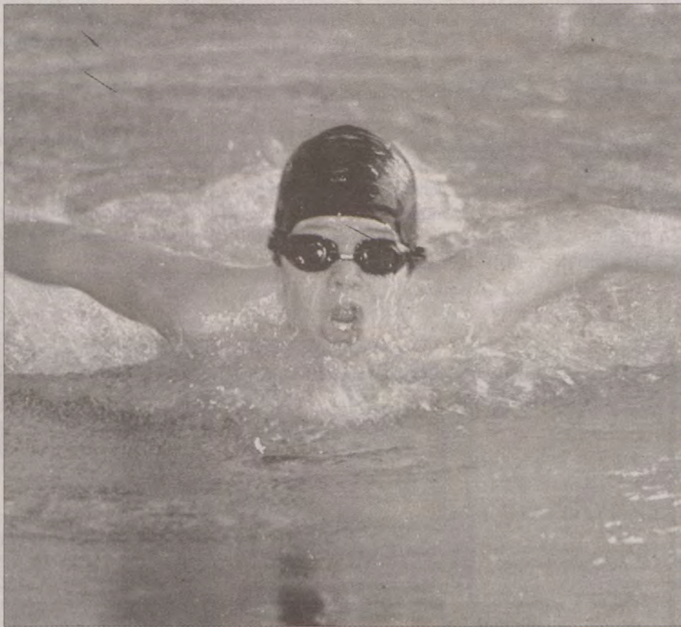
Starogardzcy pływacy bardzo dobrze zaprezentowali się podczas pierwszej rundy ligi pomorskiej.