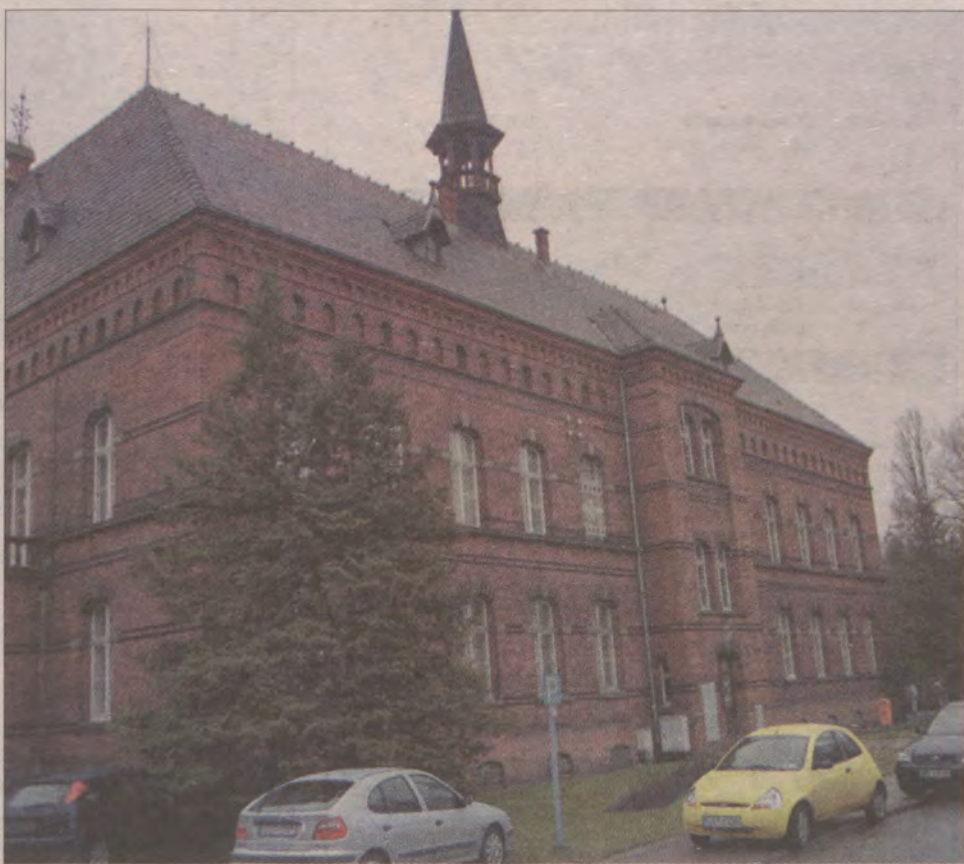
Szpital w Kocborowie został wybudowany w 1905 roku.

Złapano go zupełnie niespodziewanie w nocy z 17 na