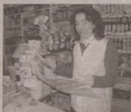
Fot. Rafał Kosecki