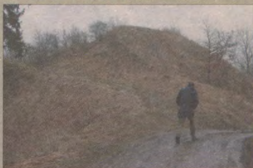
Fragment grodziska w Owidzu.