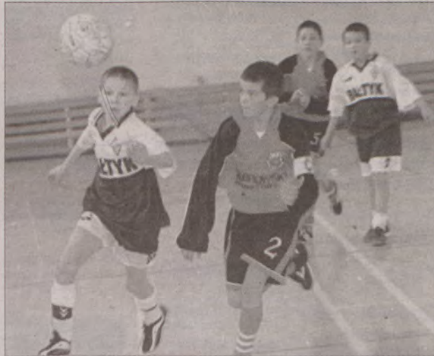
Drugi turniej rocznika 1988 rozgrywano na hali sportowej PSP 1.

Takiego turnieju halowego w Starogardzie Gd. jeszcze nie było! W dniach 7-9 lutego w Miejskiej Hali Sportowej odbywać się będą mecze III Ogólnopolskiego Halowego Turnieju Piłki Nożnej rocznika 1988 o Puchar Prezydenta Miasta MK CUP 2003. W turnieju wystąpią takie zespoły, jak Zagłębie Sosnowiec, UKP Zielona Góra, Sandecja Nowy Sącz, Stomil Olsztyn, Hetman Białystok, Bałtyk Koszalin, Lechia Gdańsk, Jagiellonia Białystok, Cartusia Kartuzy, Bałtyk Gdynia, ŁKS Łódź i gospodarze. Uczestnicy w większości występowali w mistrzostwach Polski rocznika 1988 NIKE CUP we Wronkach. Tak więc w Starogardzie Gd. zagra krajowa czołówka. Mecze będą rozgrywane w piątek i sobotę o godz. 7.30 do 17.30 oraz