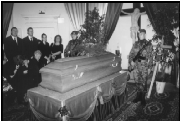
Wystawienie trumny w Kaplicy Cmentarnej

rządu Wojewódzkiego PSL w Słupsku oraz skarbnika Naczelnego Komitetu Wykonawczego PSL w Warszawie. W bardzo trudnych latach 1989 – 1990, obfitu-