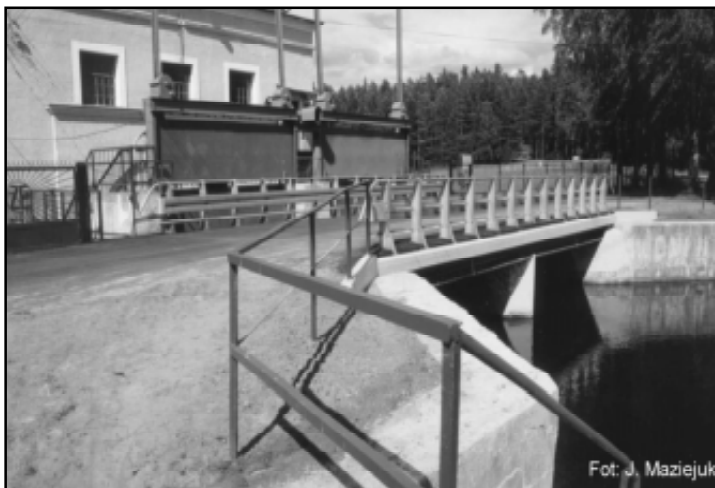
Przebudowany most w Krzyżynie

stowych ze Słupska, Drogi i Mosty Sp. z o.o. ze Słupska, Lęborskie Przedsiębiorstwo Robót Drogowych i Przedsiębiorstwo Robót Drogowych „PEER-DE” z Człuchowa. Podwykonawcy to: Giachino Bitumi Sp. z o.o. z Sopotu, Bitupol Sp. z o.o. z Warszawy, Strada Sp. z o.o. ze Środy Wielkopolskiej i Intersphalt Sp. z o.o. z Obornik Wielkopolskich. Wykonawcą robót mostowych jest firma MOSBUD z Koszalina.