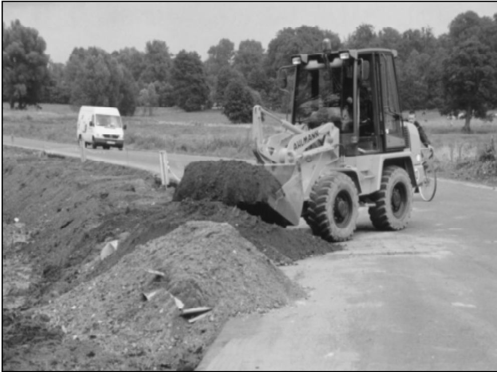
Budowa podłoża pod chodnik na trasie Sierakowo-Kończewo

nitarniej – podłączenie miejscowości Malczkowo do oczyszczalni ścieków w Łupawie”, „Budowa sieci wodociągowej w Wieliszewie z podłączeniem do oczyszczalni ścieków i hydroforni w Karżnicy”; w gminie Dębica Kaszubska: „Budowa hali sportowej”, „Skąd nasz ród” - salon wystawienniczy oraz Centrum Informacji Turystycznej; z gminy Słupsk: „Hala wi-