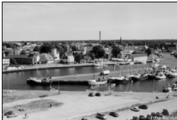
Panorama Ustki - port morski

Pierwszy dzień pobytu młodych Szwedów w Ustce rozpoczął się od wspólnego