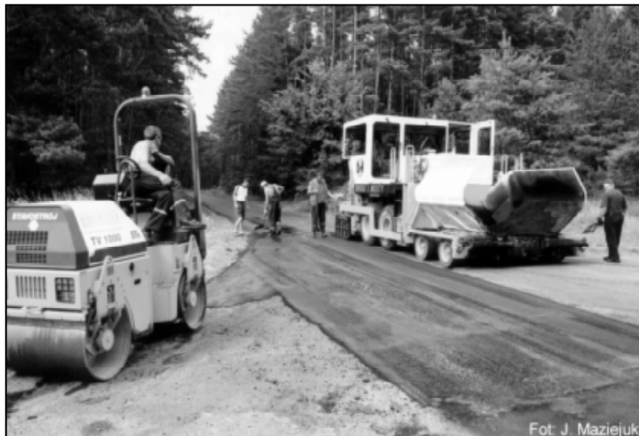
Prace na drodze w Dębnie Kaszubskiej