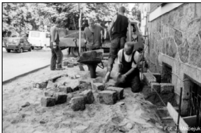
Prace wykonują pracownicy spółki „Drogi i Mosty”

Zarząd Powiatu Słupskiego wyraża wdzięczność i składa serdeczne podziękowanie wszystkim firmom, które przyczyniły się do modernizacji chodnika i zmiany wizerunku siedziby starostwa. (z)