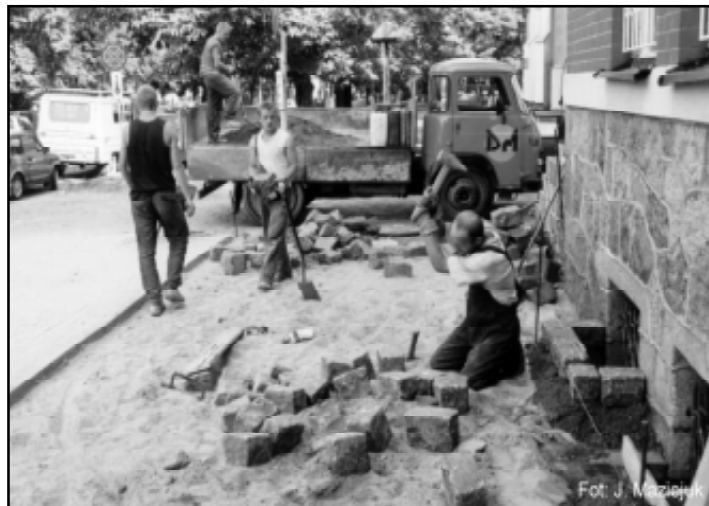
Układanie nowego chodnika

Wypiękniął chodnik przed budynkiem Starostwa Powiatowego w Słupsku. Upiększają go nie tylko ukwiecone o tej porze roku gazony, ale przede wszystkim zmieniła się jego nawierzchnia.