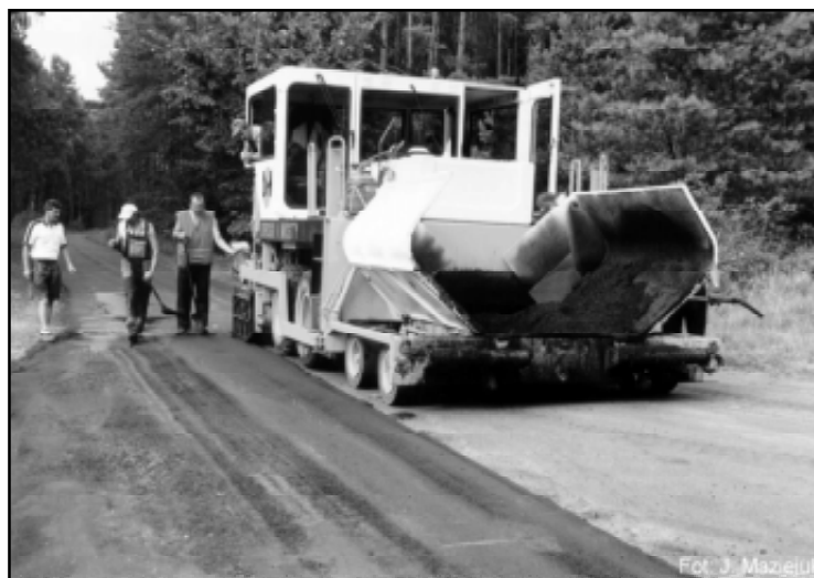
Wylewanie nowego dywanika na drodze powiatowej w Dębnicy Kaszubskiej - od krzyżówki do Starnice

dwa mosty i podniesiono ich klasę nośności do 30 ton. Na drodze Starnice-Krzy-