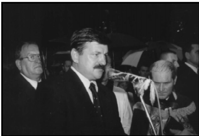
Starostę żegna wicepremier Rządu RP, prezes PSL - Jarosław Kalinowski