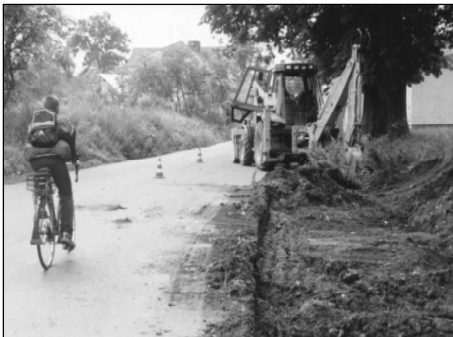
Mieszkańcy Kończewa z własnej inicjatywy rozpoczęli budowę chodnika