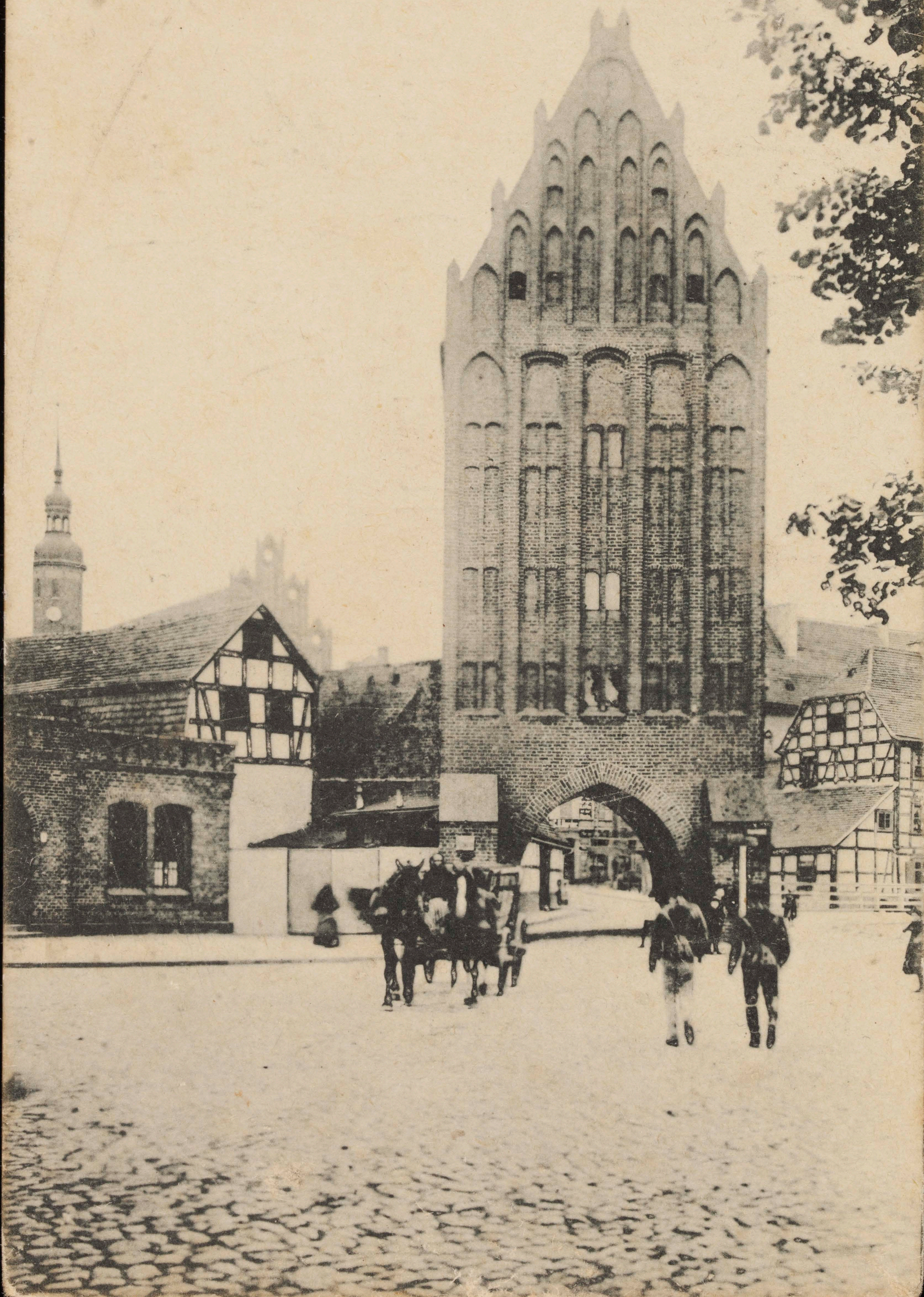
Stolp — Am Mühlentor