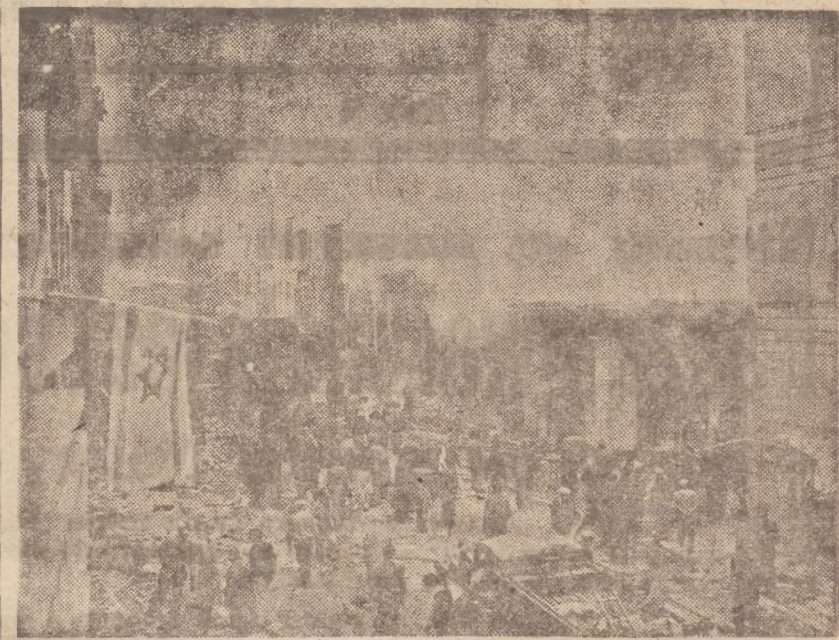
Edj^die praedstawis ulicę Ben-Jehuda w Jerozolimie w chwilę p© wybac.hu Ag. liu^ir. API

MOSKWA (API). Agencja Tass donosi, że radzieckie ministerstwo spraw zagranicznych przesłało jeszcze w dn. 30 stycznia rb. do ambasady amerykańskiej w Moskwie notę wskazującą na wielokrotne naruszenie wolności żeglugi handlowej przez samoloty amerykańskie, które śledziły radzieckie statki handlowe na Morzu Żółtym i Japońskim. Przelatywały one nisko nad tymi statkami, nurkując niekiedy nad nimi. Nota podkreśla, iż ministerstwo spraw zagr. ZSRR oczekuje, że rząd Stanów Zjedn. wyda odpowiednim władzom instrukcje celem zlikwidowania podobnych wypadków aa