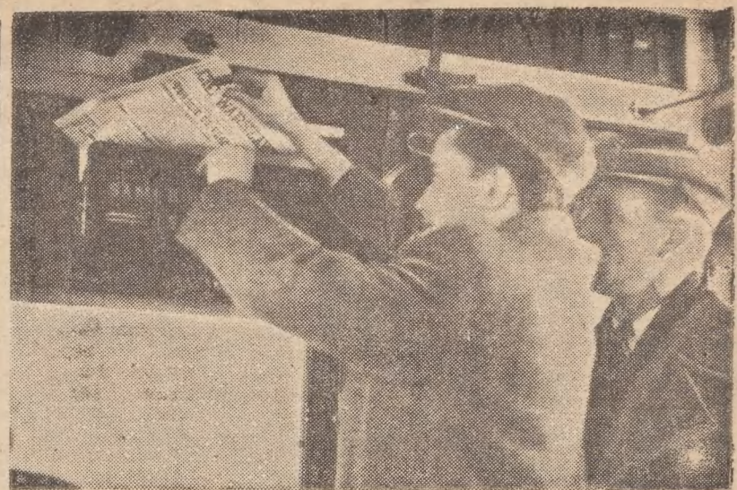
Warszawiak kupuje gazetę w skrzynce dopiero dziś — Szczeciński, robi to już dawno

Skład Legii podamy w numerze jutrzejszym.