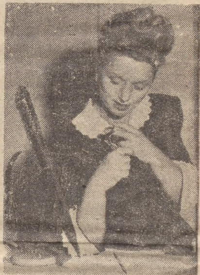
Ołówek do... zapalania papierosów — najnowszy krzyk mody wśród sekretarek

Badania przeprowadzone ostatnio przez A. Saulajrac na szczurach i myszach wykazały, że w powstawaniu uczucia głodu rolę decydującą odgrywa zjawisko wchłaniania pożywienia przez ścianki jelit.