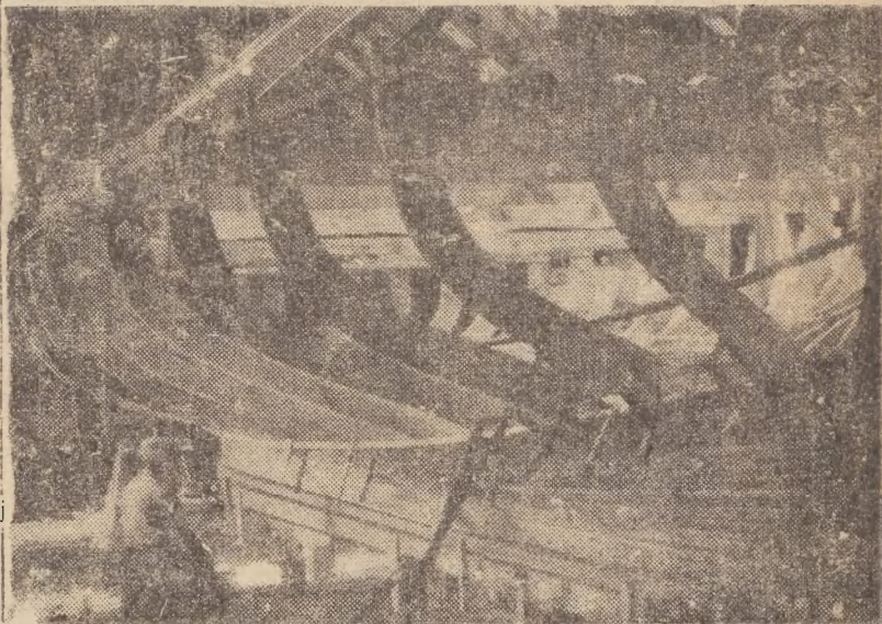
fol. W. Zubrzycki.