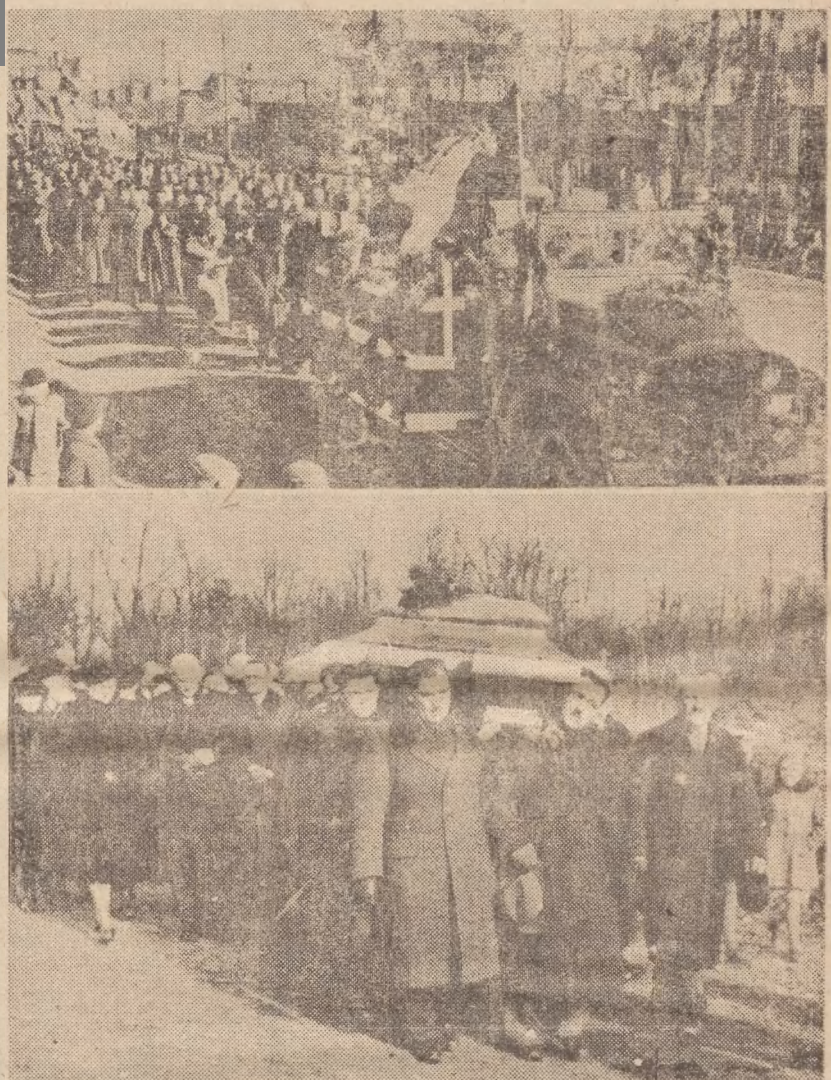
Ag. Ilustr. API 38 marca zmarł w Warszawie nsetci Polse Maksym i r.a Ma"li -ski, Powyżej poclijemy dwa zdjęcia I pogrzebu zasłużonego działacza ludowego.