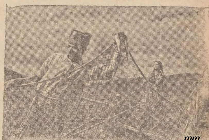
Dziesiątki tysięcy repatriantów z Bejrutu łapie pstragi w jeziorze górskim Siewan (największym jeziorze Ormении).

Wobec tego, że w naszym kraju korespondenci zagraniczni powołani do życia w naszym kraju nie mają swobodnego dostępu do informacji i ich informacja nie jest poddana żadnej cenzurze po stronie państwa.