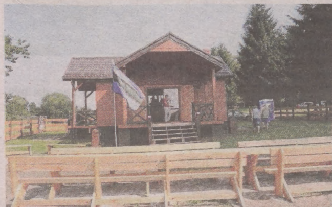
Rozbudowa stacji ma się zakończyć do czerwca, kiedy zaplanowano zawody wędkarskie

- Otrzymaliśmy 88 tysięcy złotych dofinansowania z unijnego programu Ryby. To 85 procent wartości projektu. Koszt prac szacuję na około 104