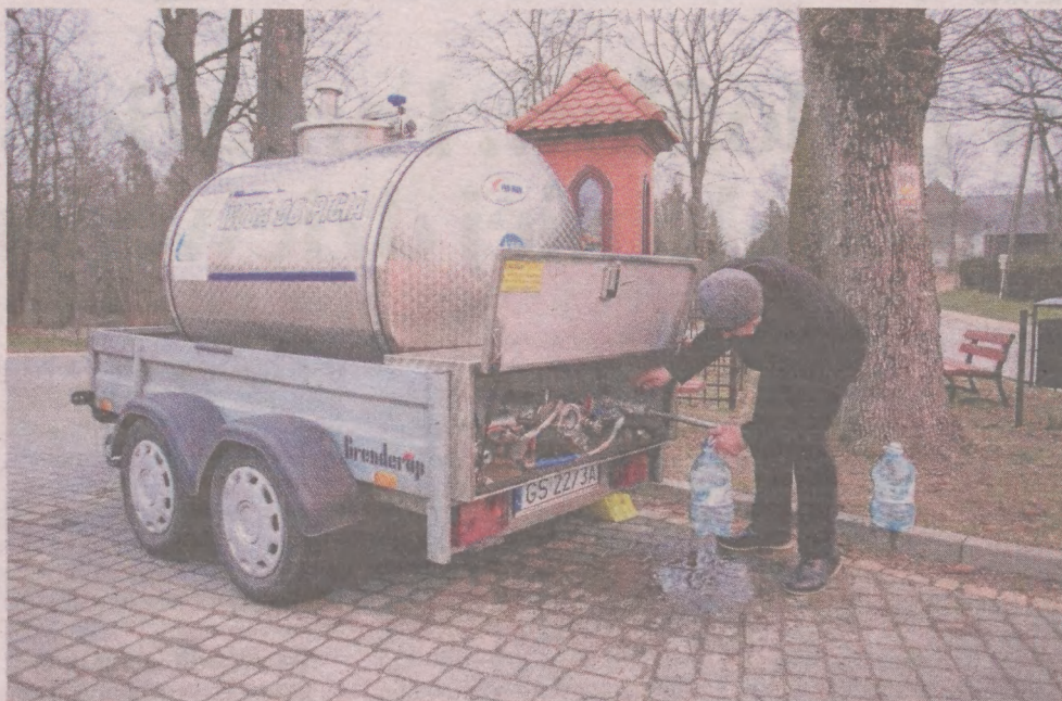
Mieszkańcy Lulemina nie mają w kranach wody zdatnej do picia. Wodociągi dostarczają ją beczkowozami

Zrobili nawet zdjęcia. Widać na nich wykonane fundamenty. O samowoli budowlanej