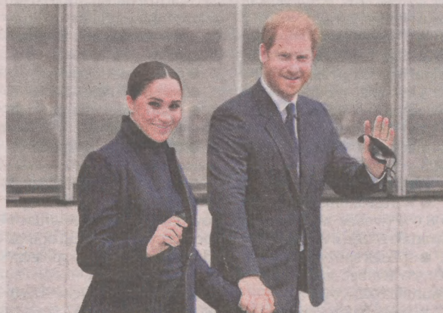
Eksperti oceniają, że choć księżę Harry i rodzina królewska mają nie po drodze, to syn króla weźmie udział w koronacji

- Mogę potwierdzić, że książkę otrzymaliśmy niedawno korespondencją e-mailową