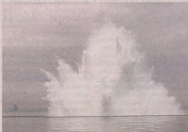
Kontrolowana eksplozja niewybuchów z czasów II wojny światowej na Zatoce Gdańskiej

Problem jest także z torpedami, innym typem broni masowo stosowanym do walki na morzu (wystrzelianych z okrętów podwodnych, nawodnych, zrzucanych przez lotnictwo). Ta część dawnych torped, która nie trafiła w cel, po wyczerpaniu paliwa opadała