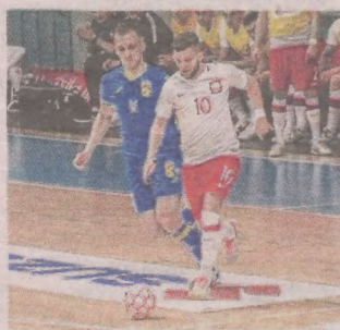
W ostatnim sprawdzianie Polska uległa Ukrainie w Kołobrzegu

Koszaliński mecz będzie transmitowany w TVP Sport (także w internecie). Studio meczowe rozpocznie się na pół godziny przed spotkaniem.