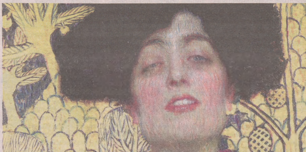
Film dokumentalny „Klimt i Schiele. Eros i Psyche” opowiada o nowych ideach

„Tár” - Lydia Tár (Cate Blanchett), przełomowa dyrygentka