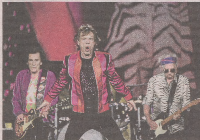
Na koncercie Lviv Aid, wspierającym Ukrainę, ma wystąpić m.in. legendarna grupa The Rolling Stones

Organizatorzy imprezy już teraz informują, że nie wszyscy zaproszeni goście będą mogli wystąpić, ponieważ może to kolidować z festiwalem muzycznym Glastonbury.