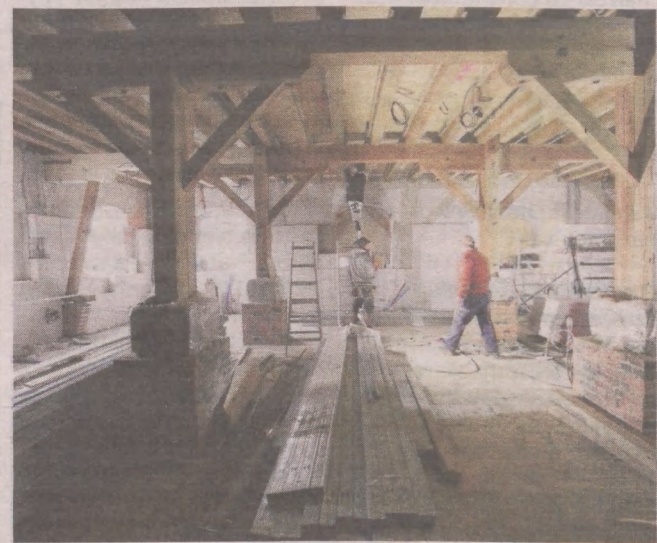
Drewniana konstrukcja Czerwonego Spichlerza oraz ściany zewnętrzne zachowały się w dobrym stanie

Górę spichlerza zajmą pomieszczenia magazynowe. ©©