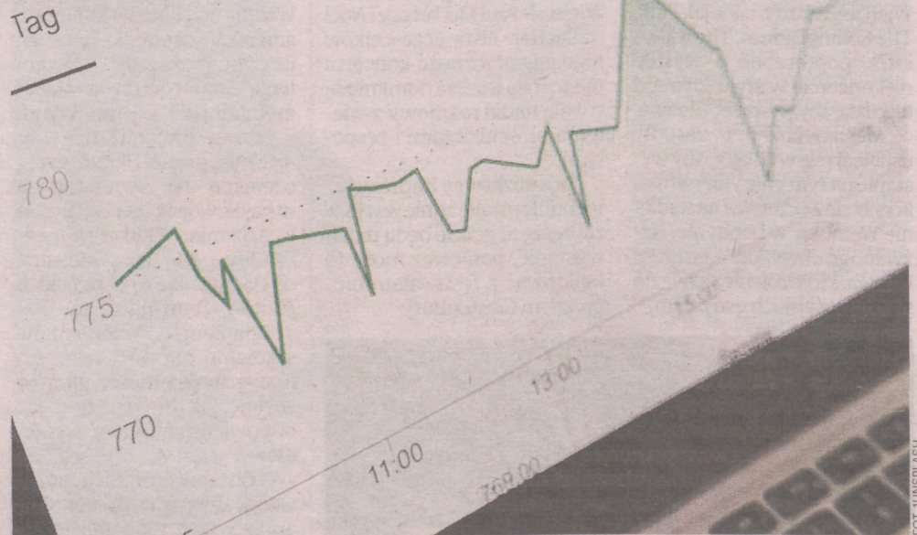
Główny Urząd Statystyczny podał wstępny szacunek produktu krajowego brutto za IV kwartał 2022 roku

W efekcie pozytywny wpływ popytu krajowego na gospodarkę wyniósł 1,1 p.