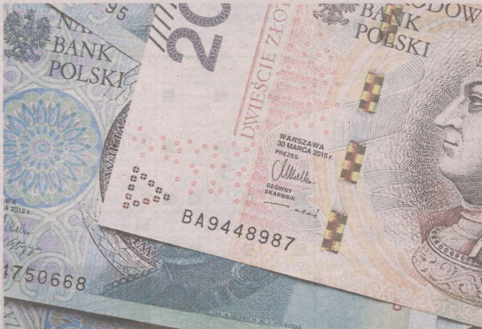
Nowe przepisy prawne mają wejść w życie na początku 2024 r.

Zmiany obejmować będą także transakcje pomiędzy konsumentami a przedsiębiorcami. Powyżej 20 000 zł nie będzie możliwości płać gotówką.