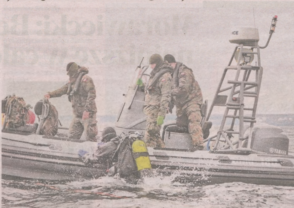
Neutralizacją dawnej amunicji zajmują się głównie nurkowie - minerzy Marynarki Wojennej