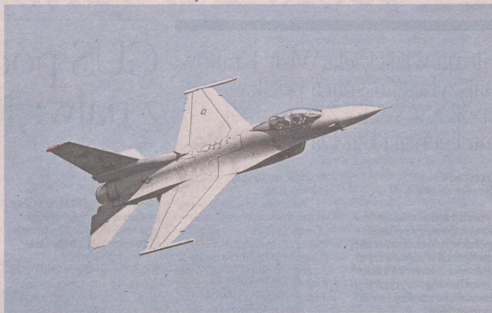
Amerykanie chcą oszacować, ile czasu może zająć przeszkolenie Ukraińców do latania samolotami szturmowymi, w tym myśliwcami F-16

Dodano, że Ukraińcy nie będą latać żadnym samolotem podczas pobytu w USA. Piloci będą używać symulatora, który może naśladować latanie różnymi typami samolotów. Podkreślono, że nie ma żadnych nowych ustaleń w sprawie de-