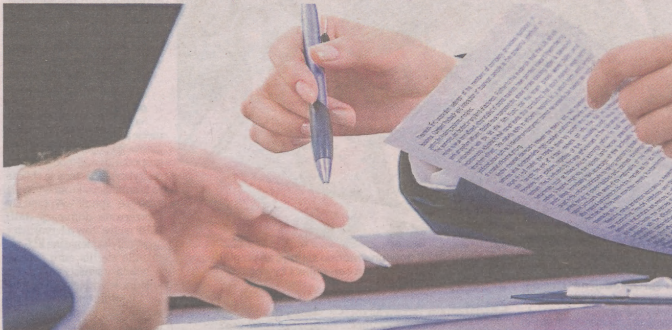
Ukraińcy najczęściej znajdowali zatrudnienie w branży usługowej, hotelarskiej, produkcyjnej, HoReCa czy e-commerce

Większość Ukraińców przebywa w Polsce, korzystając z ochrony czasowej, czego potwierdzeniem jest otrzymanie numeru PESEL zgodnie z ustawą o pomocy obywatelom Ukrainy w związku z konfliktem zbrojnym na terytorium tego państwa. Obecnie zarejestrowanych na tej podstawie jest prawie 1 mln osób. Kobiety i dzieci stanowią ok. 87 proc. tej grupy. Dzieci i młodzież to ok. 43 proc. obywateli Ukrainy posiadających numery PESEL. Wśród osób pełnoletnich kobiety stanowią na-