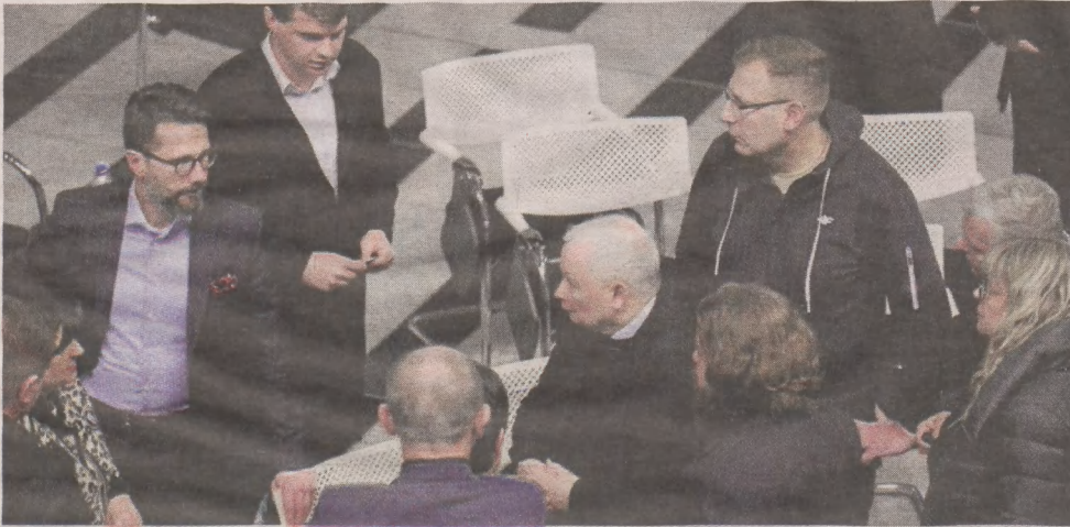
W siedzibie TVP politycy PiS, m.in. Jarosław Kaczyński, pojawili się najpierw we wtorek późnym wieczorem, a potem w środę po południu

Resort kultury poinformował w środowym komunikacie, że szef MKiDN Bartłomiej Sienkiewicz odwołał 19 grudnia br. dotychczasowych prezesów zarządów Telewizji Polskiej, Polskiego Radia i Polskiej Agencji Prasowej oraz rady nadzorcze. Minister powołał nowe rady nadzorcze spółek, które powołały nowe zarządy spółek. We wtorek Sejm podjął uchwałę w sprawie „przywrócenia ładu prawnego oraz bezstronności i rzetelności mediów publicz-