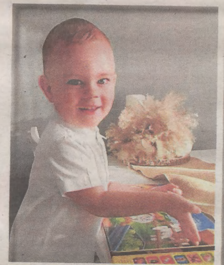
Oftrier Jermalonek Słupsk