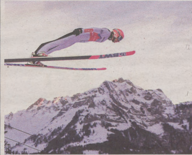
Polacy mają za sobą najgorszy początek sezonu w XXI wieku, a za rogiem czeka już Turniej Czterech Skoczni

Zawody rozpoczną się w piątek (22 grudnia) o godz. 17.00. Konkurs kobiet zaplanowano 15 minut wcześniej. Transmisja w TVP Sport i aplikacji mobilnej sport.tvp.pl. ©