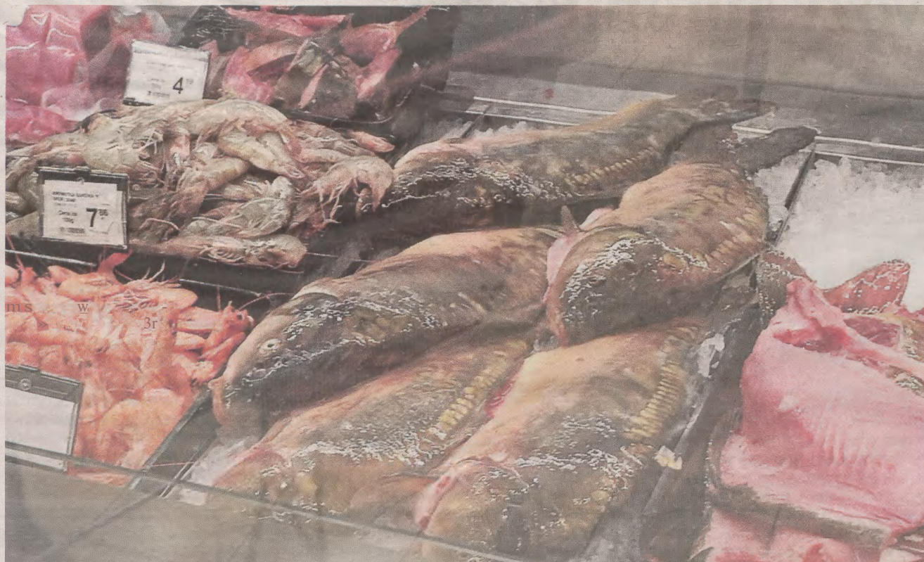
Wczoraj w centrum Szczecina karp cały kosztował 26,9 zł za kilogram. Hipermarkety odchodzą od sprzedawania żywych ryb przetrzymywanych w basenach

- Chodziło o przedłużenie świeżości tej ryby. Obecnie są