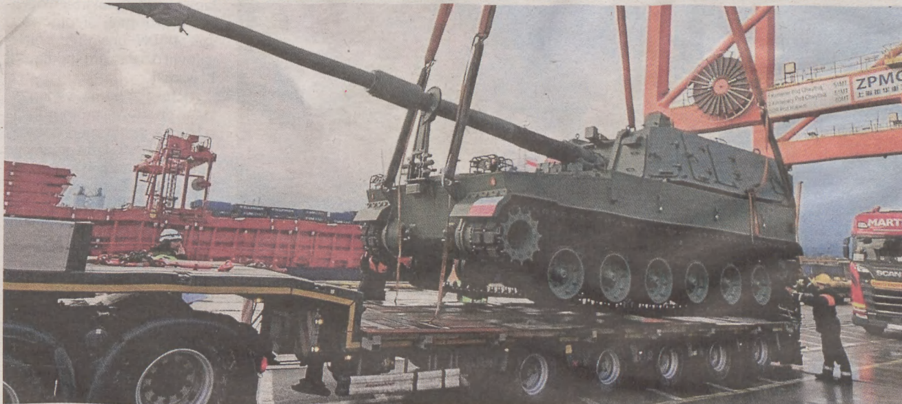
Wyładunek armatohaubic K9PL w porcie w Gdyni

1 grudnia br. została zawarta druga umowa powiązana z po-