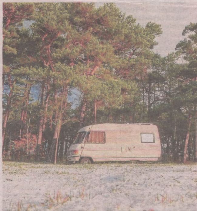
Podróż kamperem dają ogromne poczucie wolności - dzięki nim możecie nocować w miejscach, o których wcześniej mogliście tylko pomarzyć