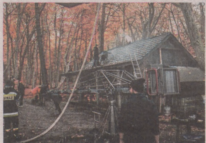
Zdjęcia do filmu powstawały głównie w lesie i nad morzem w Orzechowie

- Dzięki tej dokumentacji przestrzeni następnego pokolenia będą mogły poznać naturalny krajobraz Polski, którego niedługo może zabraknąć - zauważają filmowcy. ©