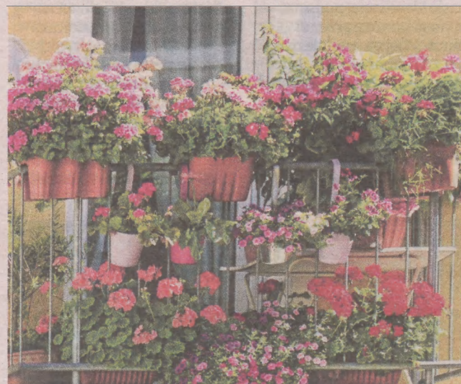
Surfinie, petunie i pelargonie sprawdzają się nawet na nasłonecznionym balkonie

Najwcześniej na balkonie warto posadzić wiosenne kwiaty cebulowe - te, które już od jakiegoś czasu bez problemu kupimy w każdym supermarkecie. Na balkonie wprawdzie będą rozwijały się nieco wolniej niż w domu, ale za to będą w nim kwitły dłużej. Tę mamy