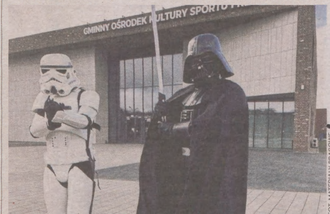
Na imprezie mile widziane będą stroje w stylu Star Wars

Gwiezdna wystawa odbędzie się w sobotę, 15 kwietnia, w godz. 10-20 oraz niedziela, 16 kwietnia, w godz. 10-18 w Gminnym Ośrodku Kultury Sportu i Rekreacji przy ul. Rekreacyjnej 1 w Przecławiu. ©