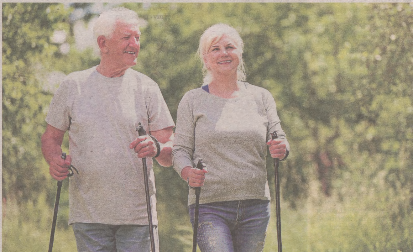
Długie spacerowanie to też forma ruchu, a z kijkami do nordic waiking - nawet rekreacji

Wśród badanych między 50. a 59- rokiem życia z formy fizycznej zadowolonych jest 60 proc., w grupie 60-69 - prawie 57 proc., a wśród osób 70+ - niecałe 48 proc. Najlepiej swoją kondycję fizyczną oceniają mieszkańcy największych miast (61 proc.), a najgorzej osoby z miejscowości do 50 tys. mieszkańców (mniej niż 50 proc.). Odsetek osób zadowolonych z formy fizycznej jest również zdecydowanie wyższy wśród aktywnych respondentów. Blisko 60 proc. z nich uważa, że ma dobrą kondycję, podczas gdy wśród pozostałych badanych jest to 37,7 proc.