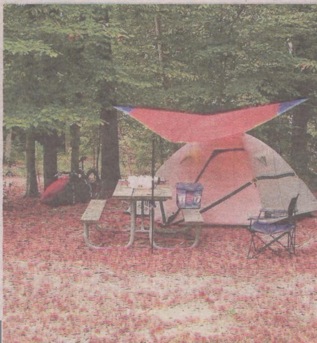
Czasem wypoczynek wśród natury to coś, czego potrzebujemy najbardziej