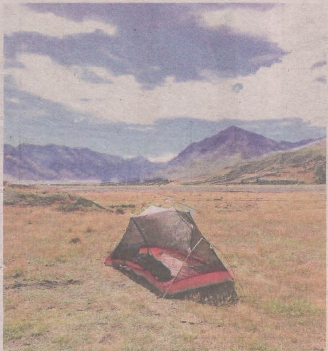
Widok na majestatyczne góry od razu po przebudzeniu? Dzięki noclegom w namiocie lub kamperze to możliwe