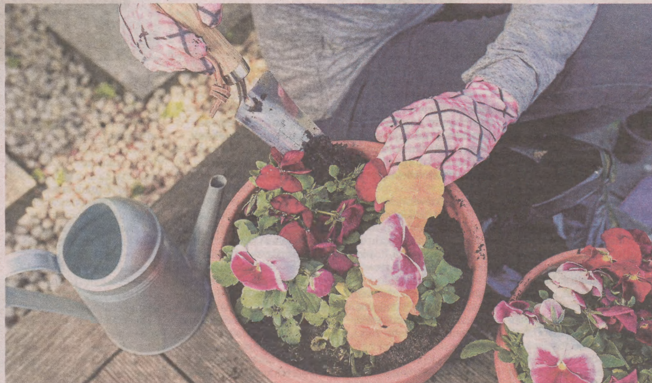
Bratki zapewnią nam ukwiecony balkon czy taras właściwie przez cały rok

Sadząc rośliny na balkonie, musimy pamiętać o ogólnych