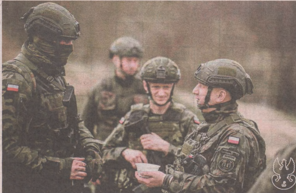
Terytorialsi z całego województwa pomorskiego, którzy rotacyjnie pełnią tam służbę w ramach operacji „Silne Wsparcie”, realizują głównie zadania patrolowe

- Są właśnie takie momenty w życiu każdego żołnierza, który nosi biało-czerwoną