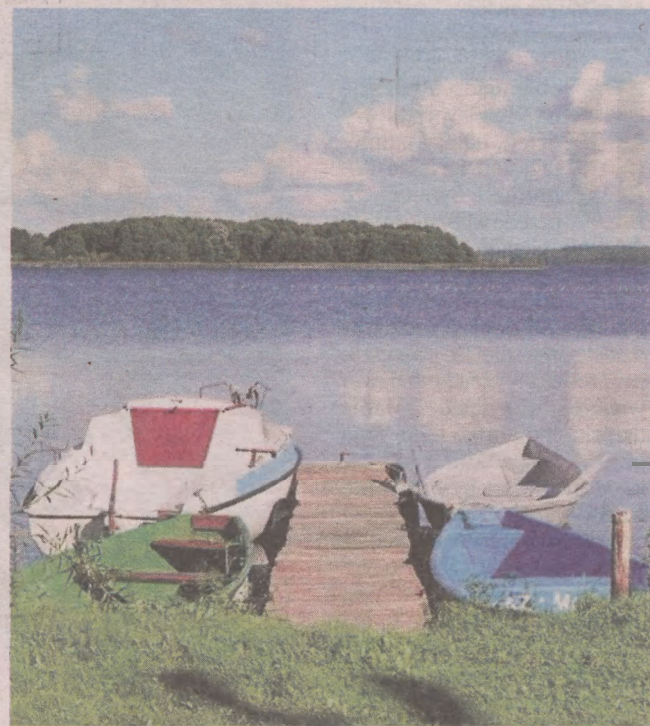
Jeden z obiektów oferuje noclegi nad jeziorem Święcajty

Jeśli preferujecie nieco bardziej komfortowe warunki, dobrym rozwiązaniem dla was może okazać się glamping, czyli nocleg w luksusowych namiotach. Słowo glamping to połączenie angielskich wyrazów glamorous (czarujący) oraz camping (kemping). Takich miejsc szybko przybywa w całej Polsce.