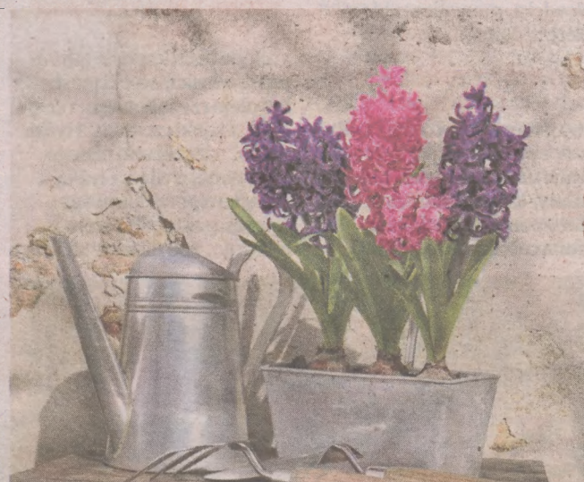
Kwiaty cebulowe, takie jak hiacynthy, niestety, cieszą nas tylko wiosną

zasadach. Doniczka powinna mieć odpływ (i podstawkę!), a najlepiej też warstwę drenażu. O tej porze roku w ziemi do kwiatów zaostrzymy się w większości sklepów (choć lepiej unikamy najtańszych, supermarketowych podłoży uniwersalnych).