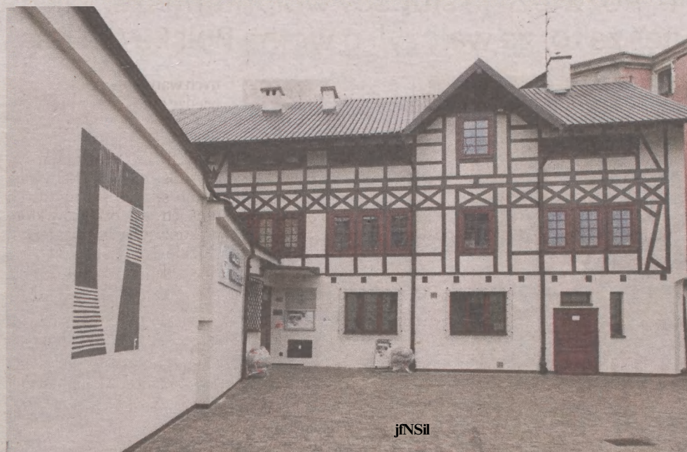
W MPŚ posłuchac będzie można m.in. o historii polskich rodzin arystokratycznych