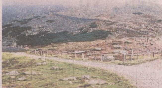
Z pola kempingowego u stóp Karkonoszy rozciąga się wspaniały widok na Śnieżkę

Mazury: kemping tuż nad jeziorem Święcajty Mazury to kraina malowniczych jezior, które - przeplatane zielonymi lasami - tworzą niepowtarzalne widoki. W cichym zakątku Węgorzewa (woj. warmińsko-mazurskie), tuż nad jeziorem Święcajty, zlokalizowany jest Camping Rusałka. Znajdziecie tam domki kempingowe, sporo miejsca dla kamperów, duże polenamiotowe, restaurację i wypożyczalnię sprzętów. To idealne miejsce na spędzenie weekendu lub majówki na łonie natury. Bardziej aktywni mogą skorzystać z oferty wypożyczalni, a cispragnieni ciszy i spokoju - spacerować urokliwymi ścieżkami prowadzącymi przez okoliczne lasy.