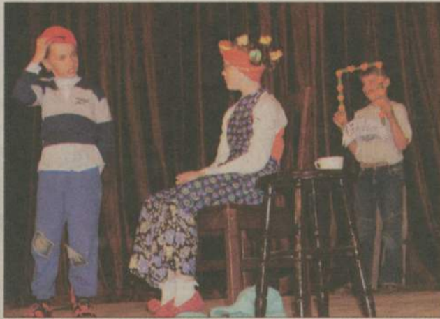
W wierszu „O Grzesiu kłamczuchu i jego cioci” Grześ prawie przekonał publiczność, że wrzucił list do skrzynki.

Kolejna edycja Konkursu Teatralnego „Wierszykarnia”, organizowanego przez Miejski Dom Kultury potwierdziła, że klasyka dziecięcego wiersza wciąż inspiruje. W „Powrocie taty” Adama Mickiewicza tytułową tatę zajechał przed dom odłotową limuzyną, a zbój, który go napadł oprócz adidasów miał też maczugę, podejrzanie przypominającą kij bejsbolowy. W inscenizacji wiersza „Dziad i baba” śmierć, ku uciesze widowni, zamiast standardowej kosi musiała zadowolić się rewolwerem. Jak się okazało, nie był to jednak efekt zamierzony.