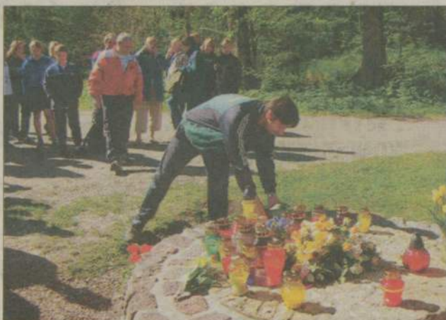
Delegacja z Niemiec zapaliła znicze pod obeliskiem upamiętniającym spływy kajakowe Brdą Karola Wojtyły.