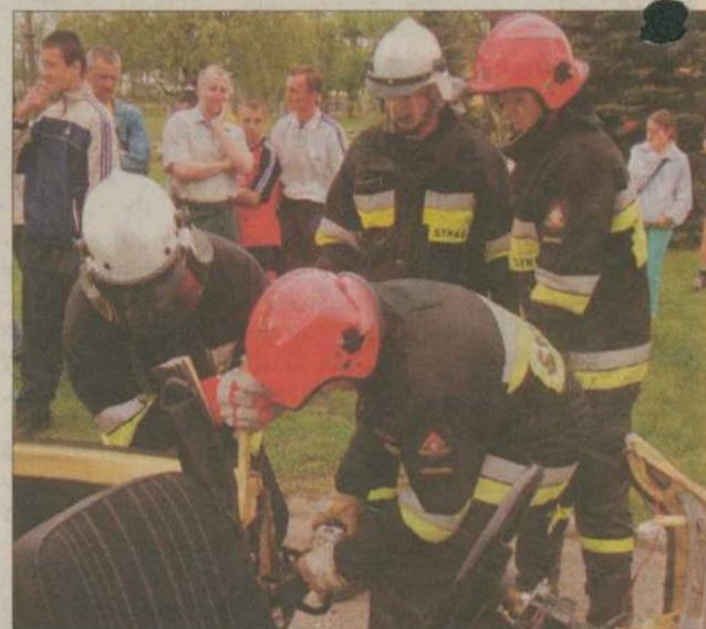
Podobnie jak w poprzednich latach dopisali strażacy, którzy pokazali jak ratują ofiary wypadków.