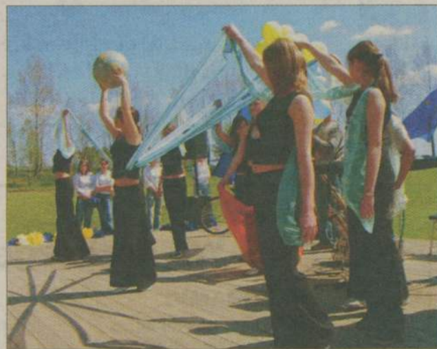
Uczniowie Zespołu Szkół w Rzeczenicy przygotowali barwne widowisko poświęcone Unii.