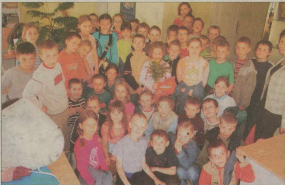
Nasi goście chętnie ustawili się do pamiątkowego zdjęcia.

- To bardzo trudna praca - podsumowali wizytę w redakcji uczniowie. (BaKa)