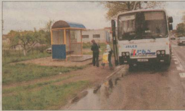
Od ubiegłego roku w Rychnowach stoją dwie nowe wiaty przystankowe.