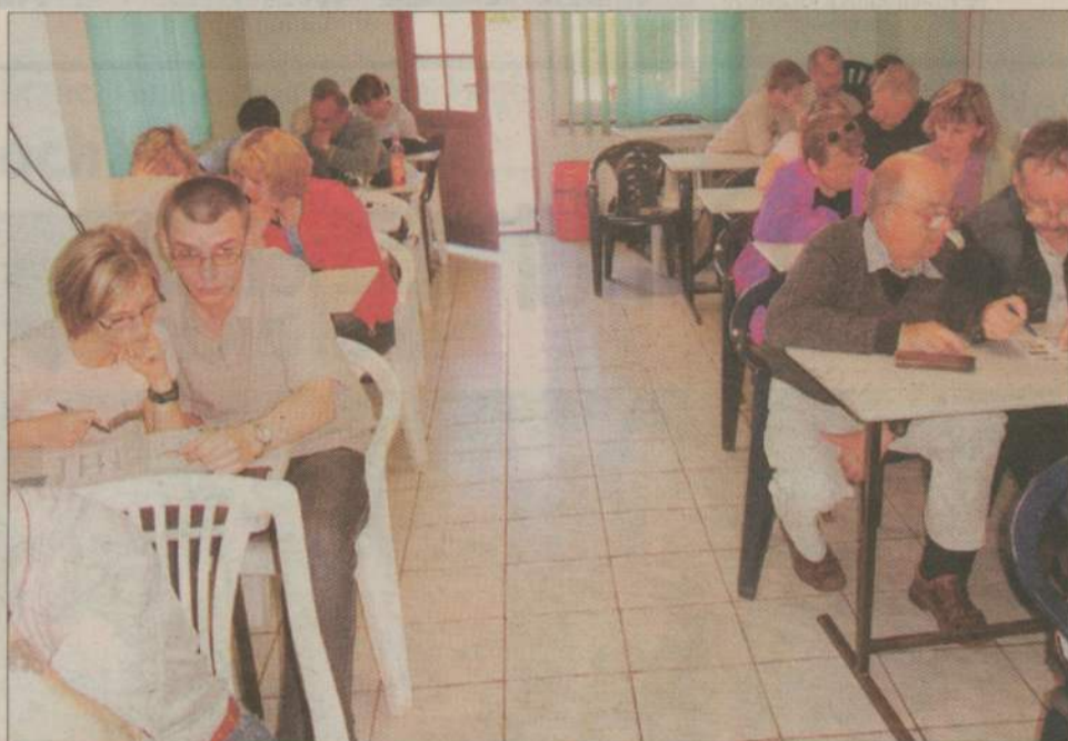
Test był jednym z najtrudniejszych elementów rajdu. Byli i tacy, którzy popełnili 11 błędów.

Coraż większe zainteresowanie towarzyszy rajdom Człuchowskiego Klubu Abstynenta „Krokus”. W tym roku odby-