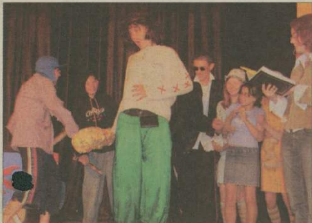
„Powrót taty” zaczął się poważnie i smutno. Kiedy jednak na scenę wkroczyli zbójcy w adidasach...