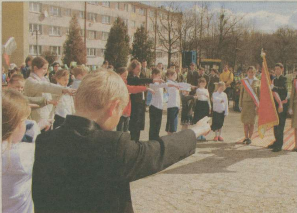
22 kwietnia tego roku w Dniu Ziemi Szkoła Podstawowa nr 1 w Człuchowie otrzymała imię Przyjaciół Ziemi oraz sztandar. Uczniowie złożyli uroczyste ślubowanie.