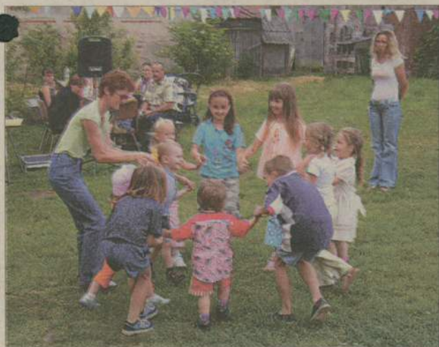
Maluchy, które nie startowały w konkursach, mogły się wyszaleć tańcząc w kółku.