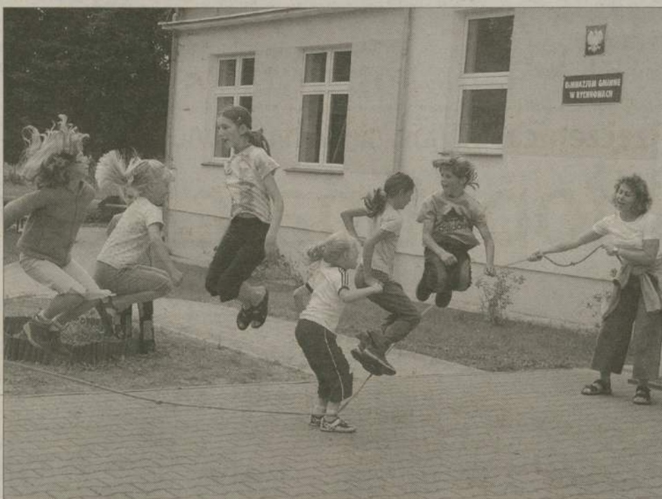
Półkolonie to dowód, że w szkole można się świetnie bawić. Na półkolonie w Rychnowach chętni przychodzili także ci, którzy na co dzień nie przepadali za szkołą.