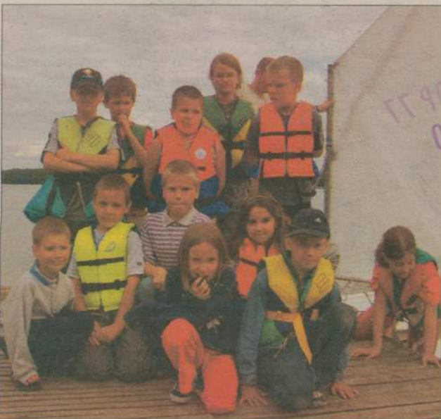
Ten obóz przyszli żeglarze będą wspominali bardzo miło.