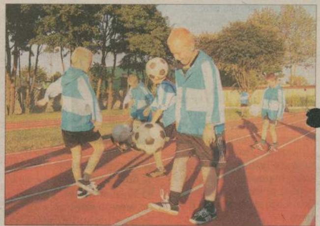
Do Człuchowa przyjechało 5 drużyn chłopięcych. Na zdjęciu: trenuje drużyna z Lubrańca, woj. kujawsko-pomorskie.