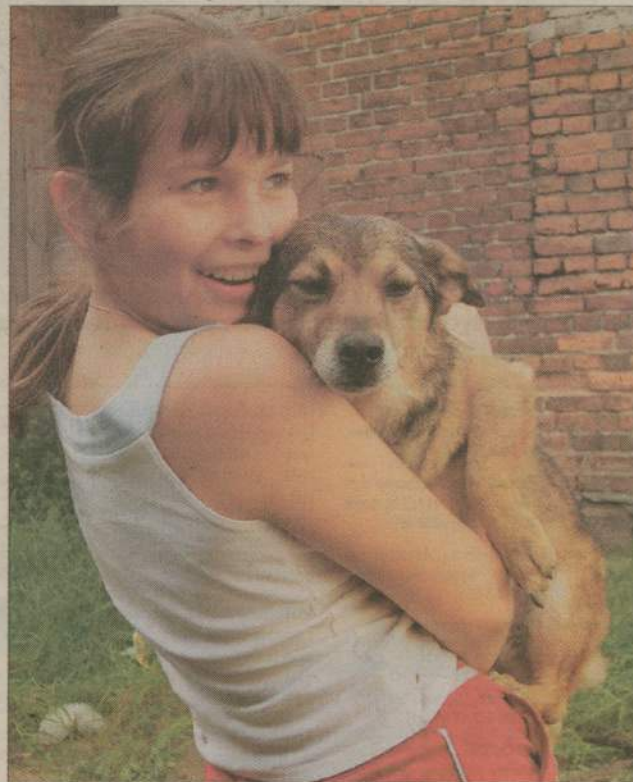
Tiko nie pójdzie do schroniska, nie zostanie też porzucony. Wiele psów nie ma jednak tyle szczęścia...

Gmina Rzeczenica nie ma podpisanej umowy z żadnym ze schronisk. Bezdomnego psa zabierają pracownicy schroniska w Chojnicach. To jednak drogie rozwiązanie, dlatego samorządy starają