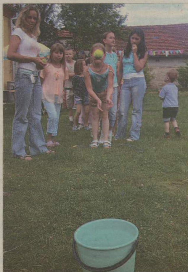
Żeby tylko trafiła...