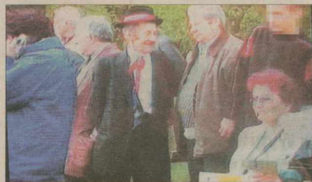
Na ekranie widać, jak młody człowiek wkłada rękę do kieszeni kurтки starosty...