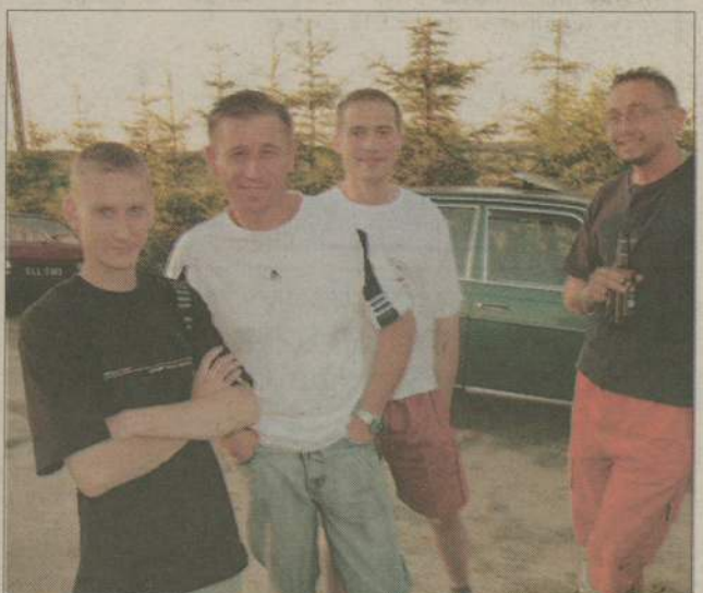
Na festynie nie zabrakło gości. Panowie z Mosin zdradzili nam, że rozglądają się za ładnymi kołdowiankami.

akurat ogromnej dmuchanej ślizgawki, chętnie dołączały do gier i zabaw przygotowanych przez organizatorów. Ogonek chętnych ustawił się też przy loterii fantowej. W przeciwieństwie do imprez organizowanych w ubiegły weekend kołdowianie mieli