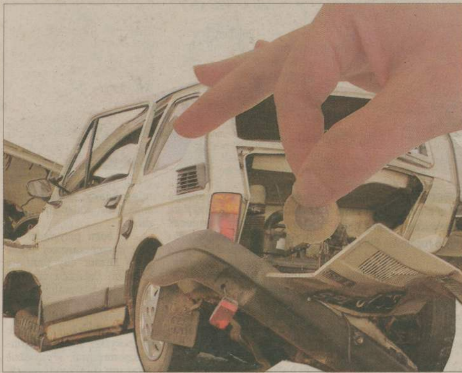
Złom to odpad naprawdę niebezpieczny. Trudno się go pozbyć i jeszcze trzeba za to zapłacić...

Takie rygory związane są z faktem, że samochody traktowane są jako odpad niebezpieczny. Firma dokonująca kasacji musi oddzielić akumulator, koła, oleje... Odbierają je specjalistyczne