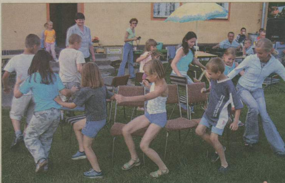
Taniec wokół znikających krzeseł to zabawa doskonale znana nie tylko organizatorom konkursów, ale również dzieciom.