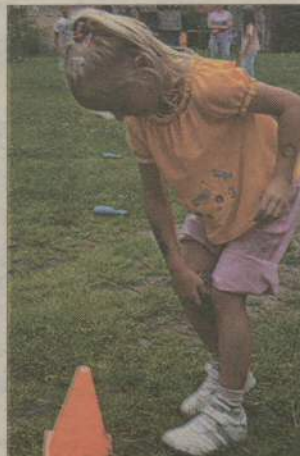
Ślalom z woreczkiem między nogami to niełatwa sztuka.