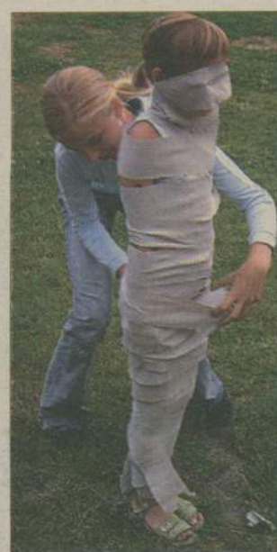
Na skompletowanie mumii potrzeba było całej rolki... papieru toaletowego.