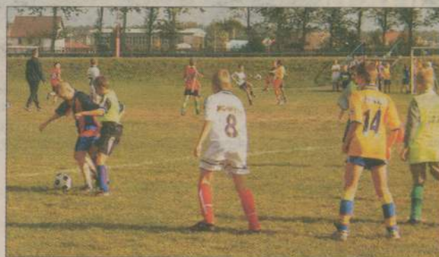
Na boisku OSiR Człuchowska młodzież na pewno nie będzie się nudzić, a przy okazji będzie mogła wygrać atrakcyjne nagrody.