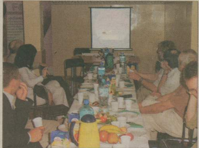
Lekarze, którzy nie wykonywali badania mogli śledzić jego przebieg na monitorze.