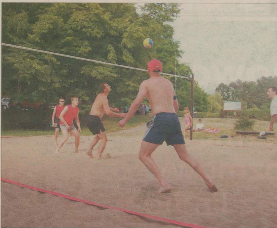
Turniej na plaży nad j. Miejskim trwał 5 godzin.