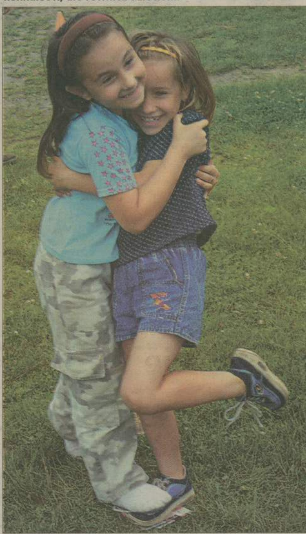
Taniec na skrawku gazety wymagał prawdziwych akrobacji.