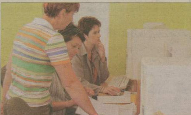
Podobnie jak w ubiegłym roku rekrutacja odbywała się drogą elektroniczną. Członkowie komisji rekrutacyjnej porównywali dane zapisane przez kandydata do szkoły ze złożonymi świadectwami.

Listy przyjętych do pierwszych klas wywieszono - wiadomo, kto dostał się do poszczególnych szkół ponadgimnazjalnych Człuchowa. Wiadomo także, jakie będą w nich profile. Na absolwentów gimnazjów powiatu człuchowskiego czekało ponad 600 miejsc w technikach, liceach oraz szkole zawodowej. W Zespole Szkół Ponadgimnazjalnych im. Stefana Czarnieckiego uczniowie zostali przyjęci do sześciu klas. W Zespole Szkół Technicznych absolwenci gimnazjów mieli do wyboru czteroletnie technika, trzyletnie licea profilowane oraz dwuletnie szkoły zawodowe. Po pierwszej rekrutacji w ZST jest jeszcze miejsce na „półtora klasy”.