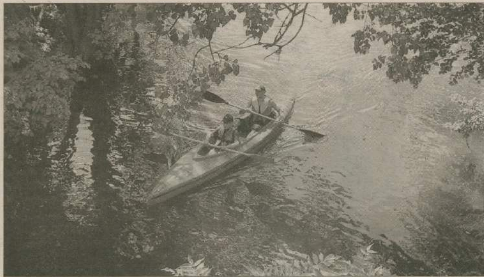
Spływy rzeką Brdą to sposób na czynny, wakacyjny wypoczynek.

Od kilkunastu do ponad dwudziestu kilometrów dziennie pokonują uczestnicy spływów kajakowych. Wartkim, niemal górskim nurtem, leniwym rozlewiskiem czy jeziorem przez kilka dni przepływają 100-200 km z biegiem Brdy. Podczas spływu cieszą się nieskażoną przyrodą i ciszą, nocują na polach biwakowych, a wieczory spędzają przy ogniskach. Organizatorzy spływów proponują najczęściej miejsce w kajaku, ubezpieczenie, zarezerwowane miejsce na polach biwakowych, transport bagaży oraz wykwalifikowanych przewodników. Za dodatkową opłatą można skorzystać z wyżywienia, noclegów czy tylko kadokolacji. Najczęściej jednak uczestnicy dysponują własnym sprzętem biwakowym i sami przygotowują posiłki na biwaku nad rzeką. Wieczór przy ognisku po całodziennym wiosłowaniu sprzyja miłej, obozowej integracji.