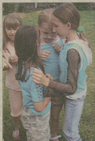
Po zrobieniu łańcucha ze spinaczy trzeba było się jeszcze nim obwiązać.