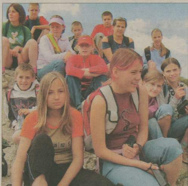
Uczniowie dotarli aż na sam szczyt Kasprowego Wierchu.