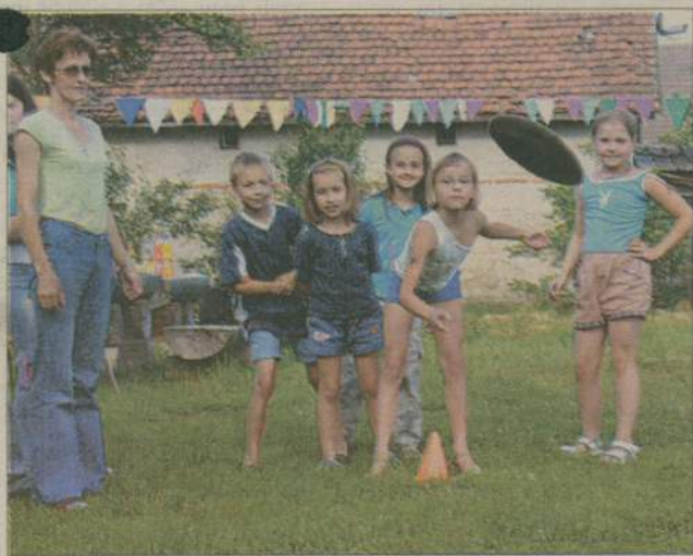
Kto trafił beretem w środek skakanki, dostał w nagrodę loda.