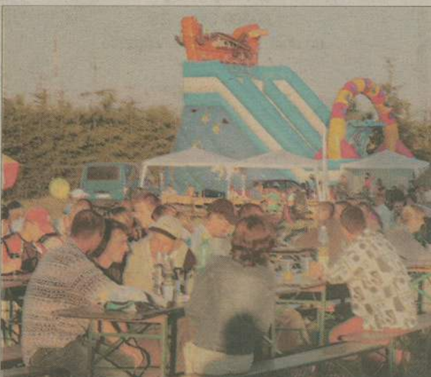
Zabawa „pod chmurką”, przy bezchmurnym niebie, udała się zarówno dorosłym, jak i dzieciom.

Na sportowo powitali lato mieszkańcy Kołdowa (gmina Człuchów). Główną atrakcją sobotniego festynu na stadionie był turniej piłkarski o puchar lata 2005. Nie brakowało jednak także innych rozrywek. Dzieci, które nie okupowały