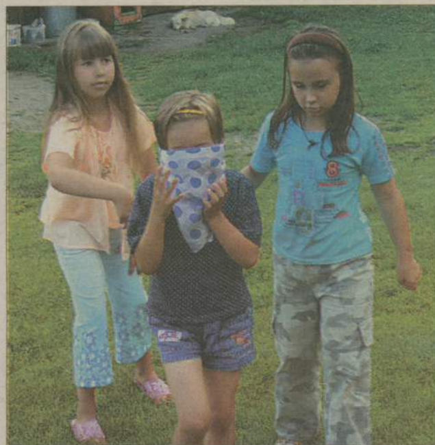
Skreć w prawo czy w lewo? A gdzie jest ta prawa...? Niektórzy z uczestników mieli z tym kłopoty.