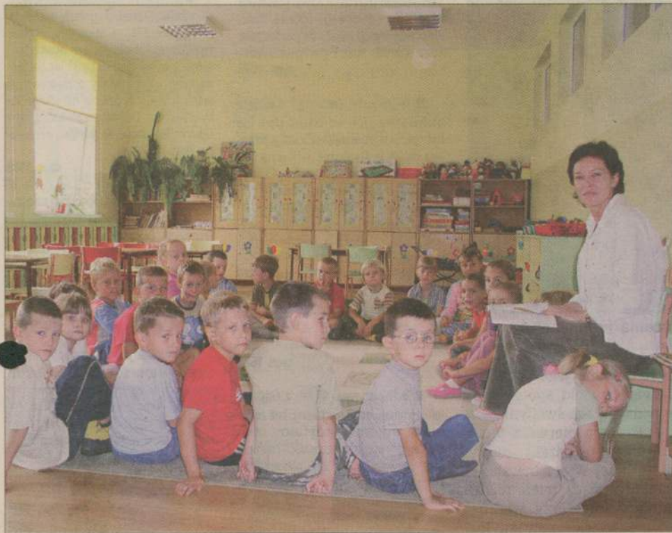
W salach przedszkolnych jest teraz kolorowo i przytulnie. Na zdjęciu: grupa Tropicielei.