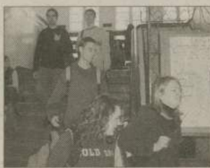
Człuchowski „ogólniak” obchodzi w tym roku swoje 60 urodziny.

nizacją jubileuszu. Ustawione zostaną m.in. gabloty z archiwalnymi zdjęciami ze szkoły, w przygotowaniu jest monografia placówki. Będzie ona miała nakład 600 egzemplarzy. Znajdzie się w niej nie tylko historia szkoły i jej osiągnięcia, nie zabraknie również nazwisk wszystkich nauczycieli oraz absolwentów. Przygotowywany jest też program artystyczny. Jolanta Kowalska, jedna z absolwentek ogólniaka, specjalnie na tę