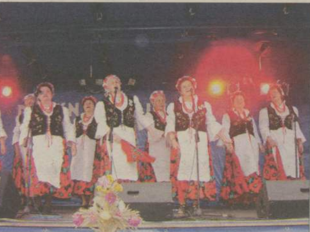
Podczas przeglądu zespołów folklorystycznych nie mogło zabraknąć debrzneńskich Słowinek.