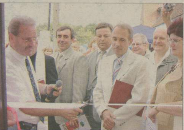
Na tę chwilę mieszkańcy Skowarnek czekali bardzo długo. W końcu mają świetlicę, której inni mogą im pozazdrościć.