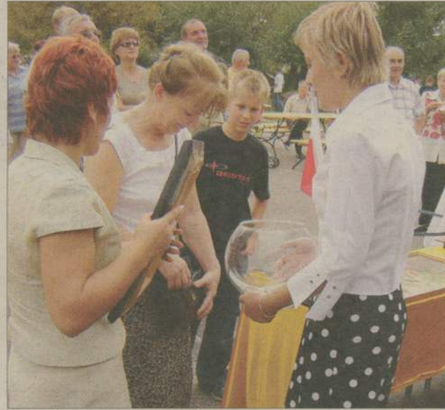
Do końca dnia pieniądze zapełniły szklane naczynie.

ile udało się zebrać dowiemy się prawdopodobnie pod koniec tygodnia.