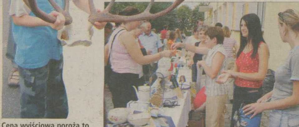
Cena wyjściowa poroża to 50 złotych. Zwycięzca aukcji zapłacił za nie 170 zł.