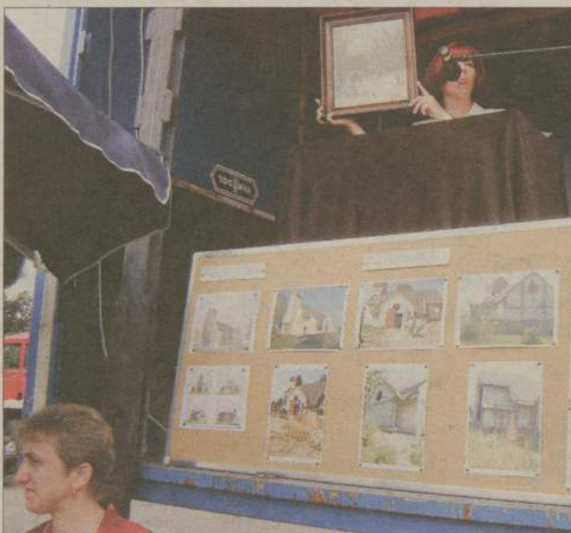
Tak w przyszłości ma wyglądać kościół w Bielsku - m.in. dzięki sobotniemu festynowi.

- Jeszcze nie wszystkie pieniądze do nas wpłynęły - mówi ksiądz Oleski. - O tym