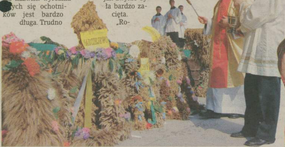
Kazimierz Nycz, biskup ordynariusz diecezji koszalińsko-kołobrzeskiej, poświęcił chleb dożynkowy i wieniec.