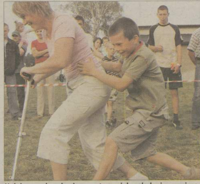
Hulajnoga okazała się sprzętem wielopokoleniowym i pojemnym...