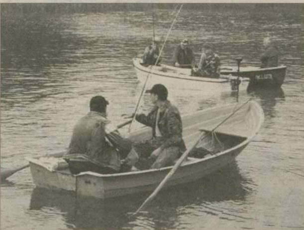
W zawodach wzięło udział 28 wędkarzy.