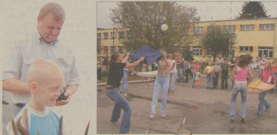
To był nietypowy mecz wyjątkowo „mokrej” siatkówki.

Ogłoszenie wyborcze zlecenie i opłacone przez Komitet Wyborczy Wyborców Ogólnopolski Bezpartyjny Ruch Społeczny 536682A