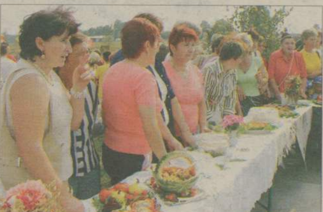
Konkurs na najlepszą potrawę zakończył się... zbiorową degustacją.