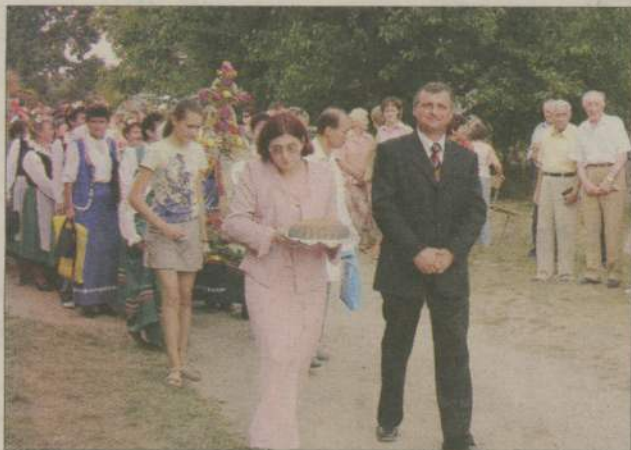
Chleb z tegorocznego ziarna - tego podczas dożynek nie mogło zabraknąć.

W Skowarnkach bawili się mieszkańcy gminy Debrzno podczas tegorocznych dożynek. To, że wybrano właśnie tę miejscowość na miejsce świętowania związane było z otwarciem świetlicy. Powstała ona w miejscu byłej kołtówni Agencji Nieruchomości Rolnych Skarbu Państwa. Dzięki wsparciu z programu „Odnowy Wsi Pomor-