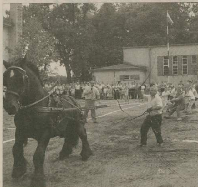
Sporą atrakcją było przeciąganie liny. Sześciu ochotników zmierzyło się z ...koniem.