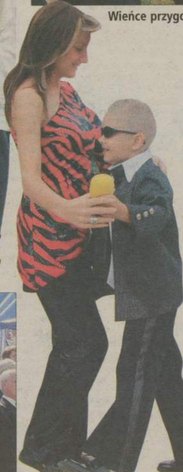
Niekonwencjonalny układ taneczny był częścią występów artystycznych.