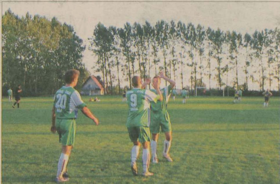
Brda Przechlewo jest obecnie liderem tabeli.