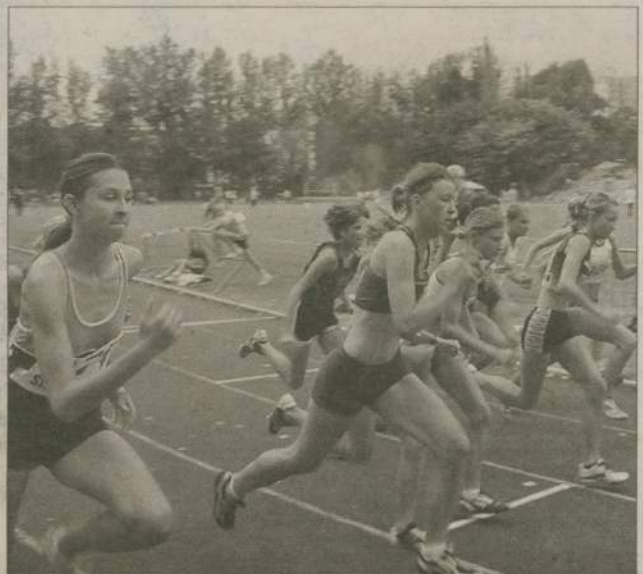
W zawodach wystartowali lekkoatleci z województw pomorskiego i kujawsko-pomorskiego.