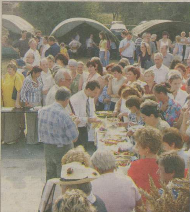
17 potraw warzywnych do skosztowania miała komisja w konkursie gastronomicznym.