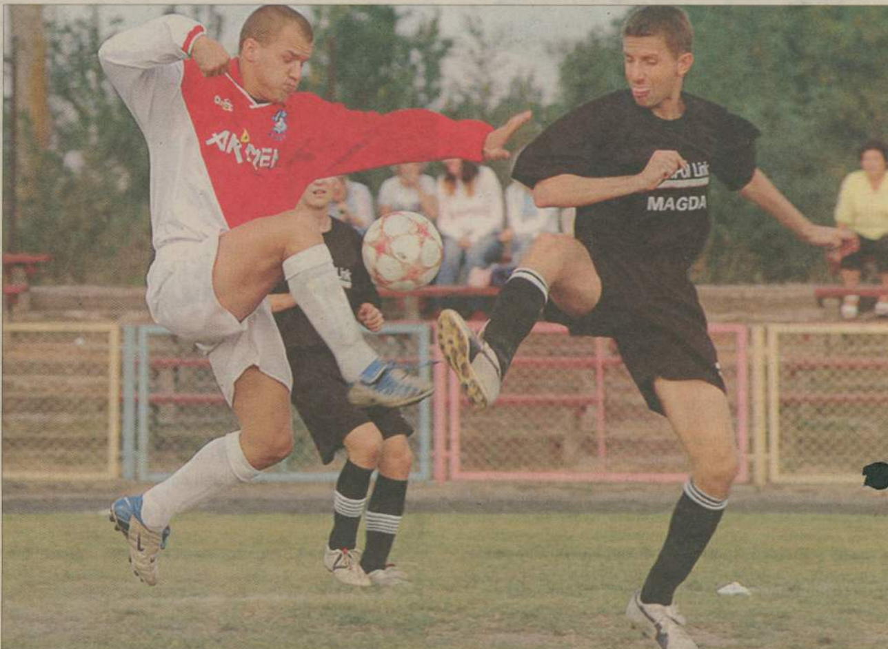
Mimo osłabionego składu, człuchowski Piast zremisował z Czarnymi Bruszkowo Wielkie.

Właśnie po meczu w Przechlewie w bardzo trudnej sytuacji znalazła się ekipa człuchowskiego Piasta. Niezadowolony z sędziowania i wyniku piłkarze z Człuchowa narozrabiali nad Brdą. Krzysztof Bednarek