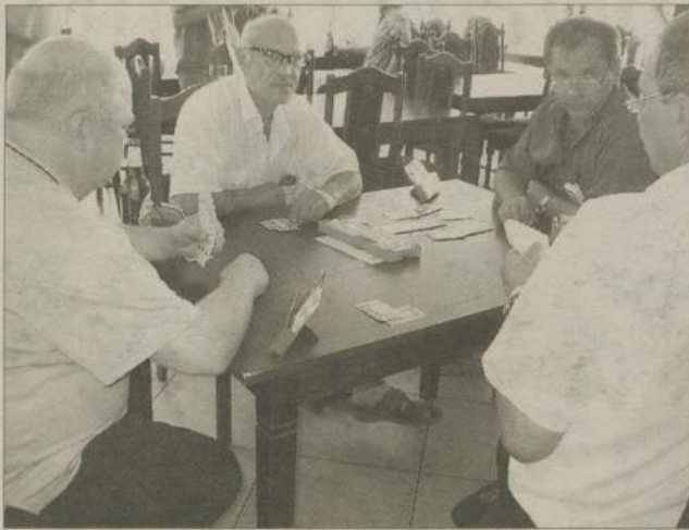
Przy zielonym stoliku zasiadło 18 par.