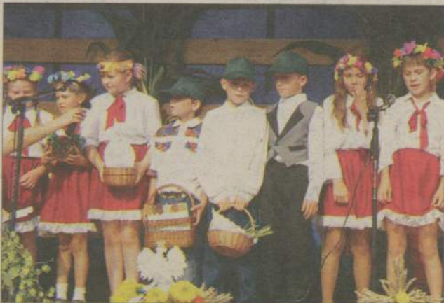
Na scenie zaprezentowały się dzieci ze SP w Stółcznie.