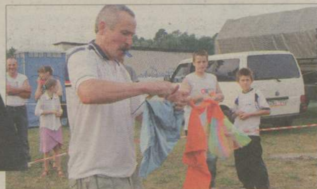
Na szczęście to pranie było tylko jedną z konkurencji turnieju wsi.