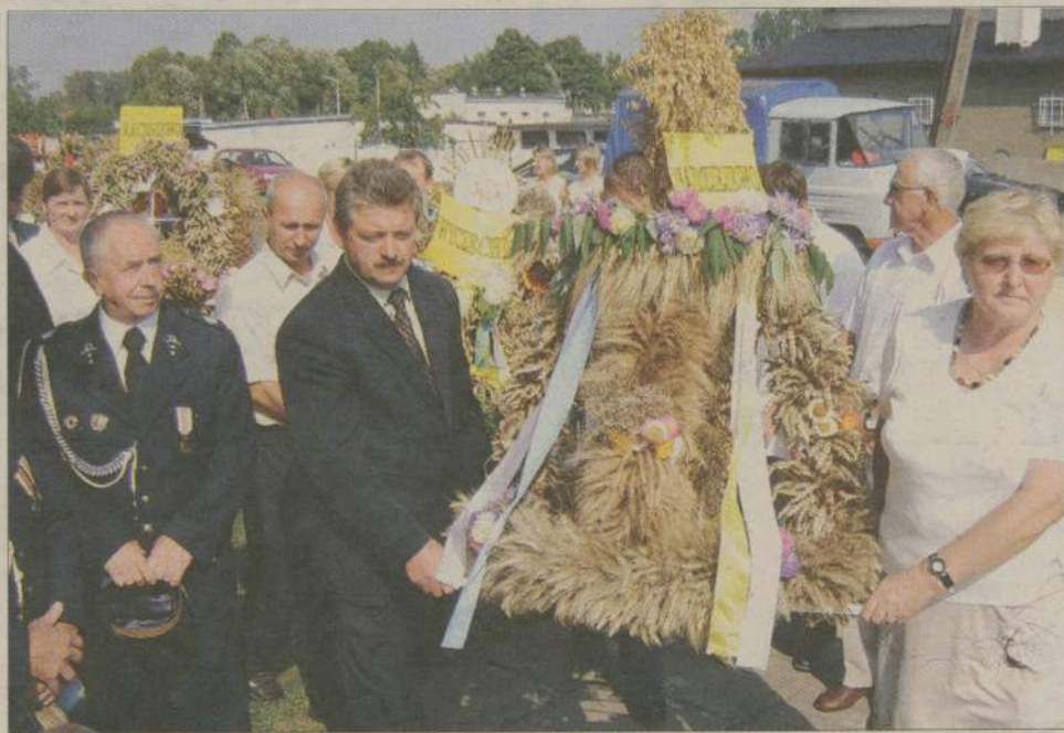
Wieniec przygotowane przez sołectwa były bardzo efektowne.