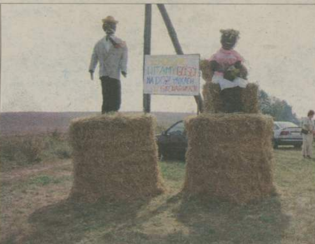
Taka para zapraszała do zabawy podczas dożynek.