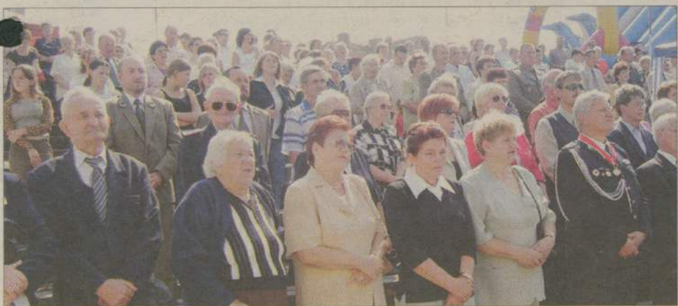
„Boże coś Polskę” odśpiewano na zakończeniu mszy świętej.