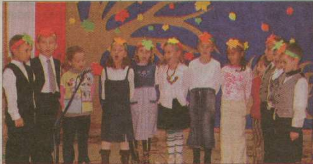
Na scenie swoje umiejętności zaprezentowali uczniowie SP w Polnicy.