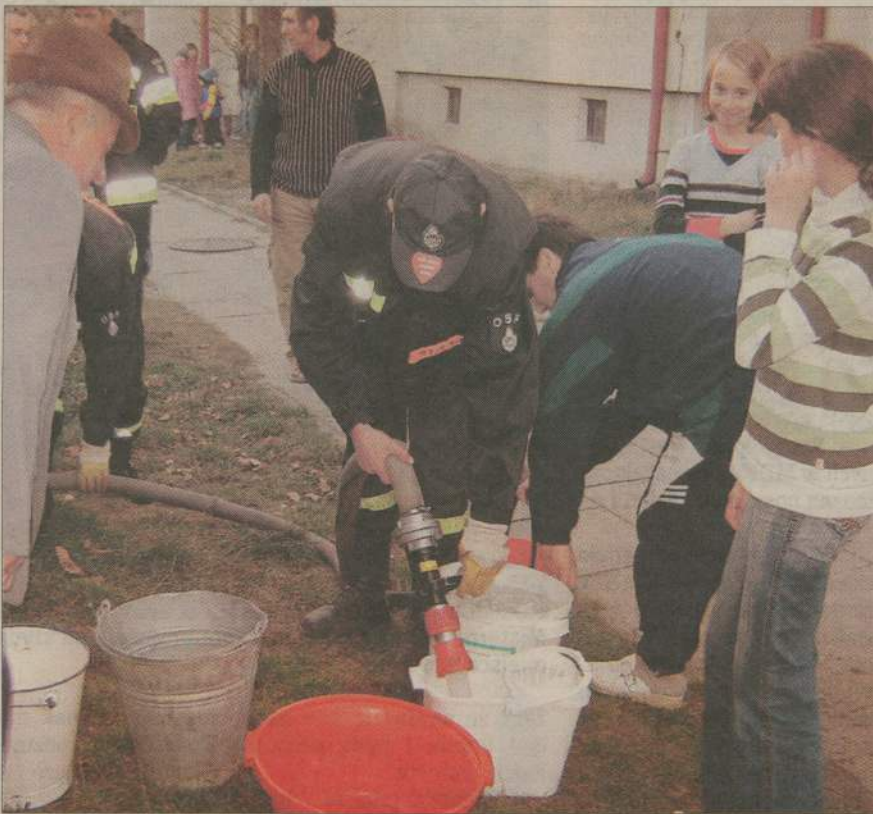
Od piątku mieszkańcy Międzyborza korzystali z wody dowożonej przez strażaków.