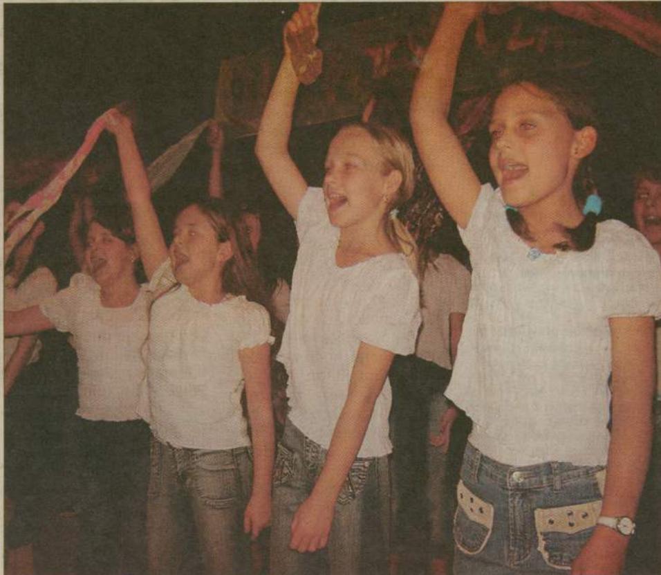
Seniorom czas umiliły występy w wykonaniu... młodszego pokolenia.