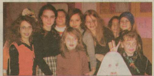
Podobnie jak kilka tysięcy lat temu obowiązywały stroje czarownic, kościotrupów, duchów, strachów na wróble, wampirów, straszdeł...