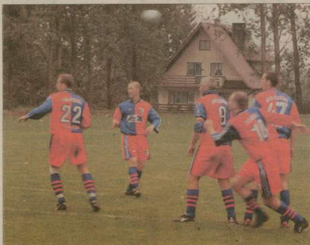
Człuchowianom udało się zremisować z jedenastką z Damnicy 2:2.

Wielkim nie będzie łatwo. Podopiecznych Zbigniewa Cyzmana stać jednak na urwanie chociażby jednego punktu gospodarzom, którzy w tym spotkaniu będą faworytami. Piotr Furtak