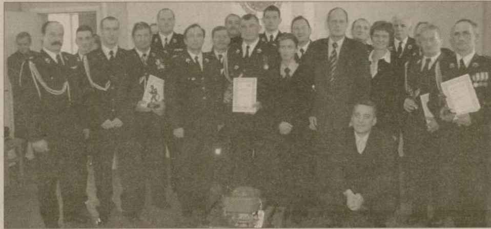
Pamiątkowa fotografia laureatów plebiscytu Strażak Pomorza 2004 na podsumowaniu w Gdańsku.