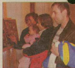
Na wystawie można było zobaczyć pamiątkowe zdjęcia z Francji, ale też okolicznościowe gadżety, a nawet „pamiątkowe” kosmetyki.