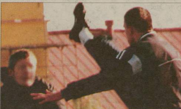
Podczas pamiętnego meczu niektórzy kibice pomylili dyscypliny sportu.

Przypomnijmy, do rozrób z udziałem kibiców Piasta Człuchów i Pogoni Lębork doszło podczas meczu w Człuchowie 9 października. Bezpośrednio po meczu pseudokibice Pogoni butel-