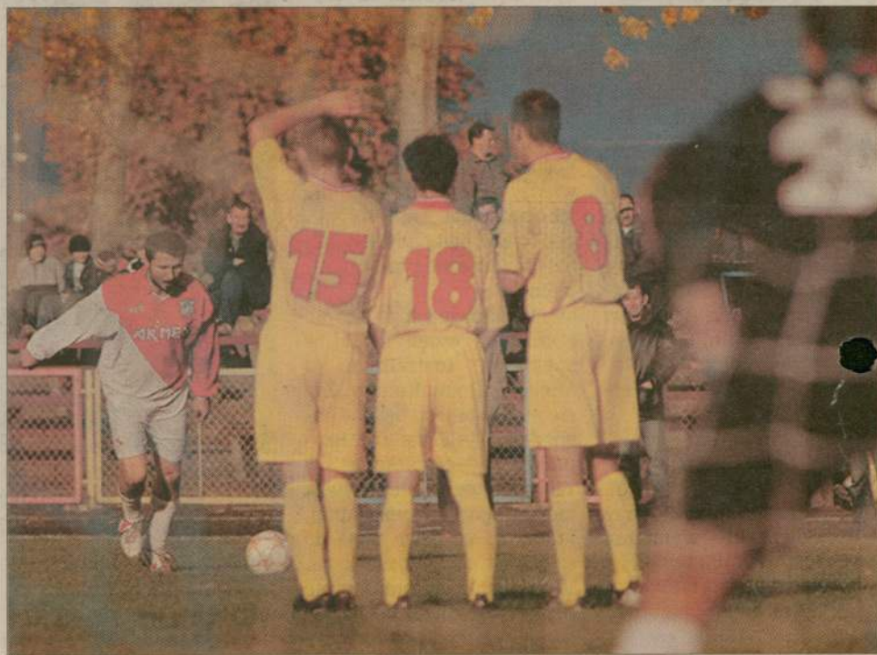
Debrzneński MKS gra nierówno. Czy pokona Pogoń Lębork, z którą zmierzy się w tym tygodniu?