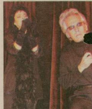
Listy i piosenki Barbary i Jacques'a Brel'a przedstawił aktorzy sceny krakowskiej.