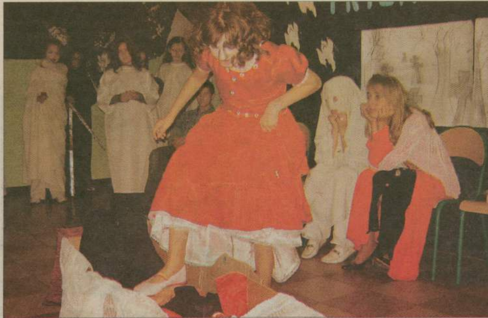
Tak strasznie może być w szkole tylko w Haloween...