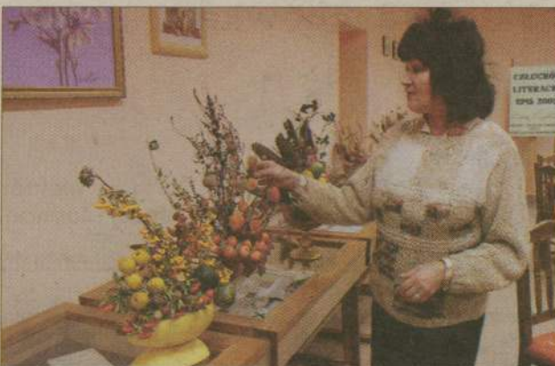
Te piękne kompozycje to sama natura - kwiaty, owoce, liście, a nawet warzywa.

Układanie kompozycji nie jest prostą sztuką. Niektóre składniki trzeba zbierać dużo wcześniej i ususzyć. Wszystko musi do siebie pasować przede wszystkim kolorystycznie, także naczynie.