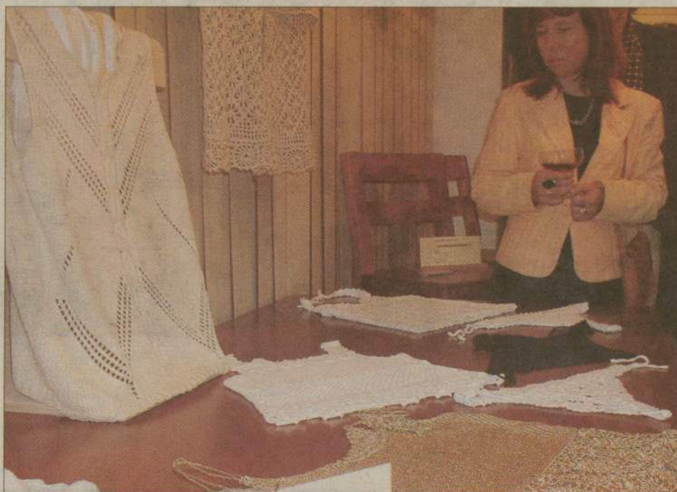
Misternie wykonane części garderoby podobały się szczególnie paniom. Panowie też zerkali na nie z ciekawością.