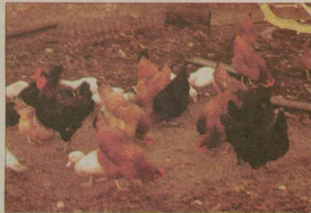
Mimo restrykcji widok wolnego ptactwa nadal jest nagminny.