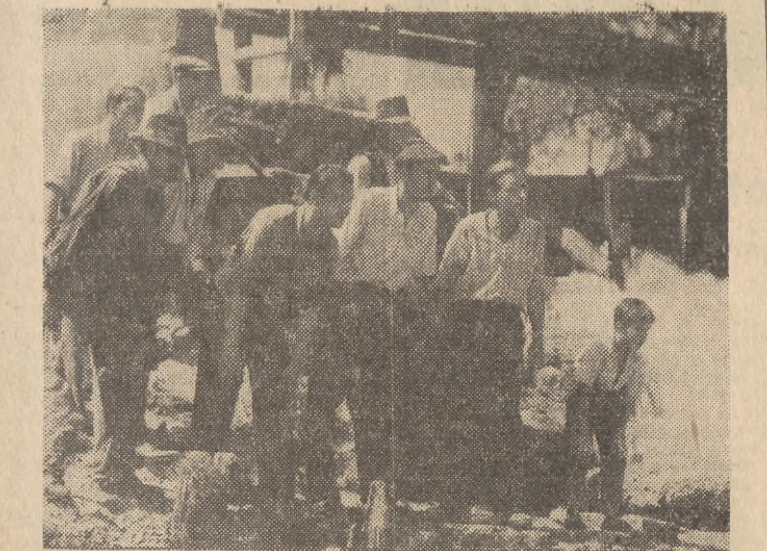
Na ekrany trójmiasta wchodzi film produkcji polskiej pt. „Gromada”. Oto jedna ze scen tego interesującego filmu.

Surowy, sprawiedliwy ten wyrok na złodziei w mienia państwowego powinien być ostrzeżeniem dla tych jednostek, które swoją przestępczą działalnością zechciałyby hamować rozwój naszej ojczyzny, wysiłek naszego narodu, budującego socjalizm.